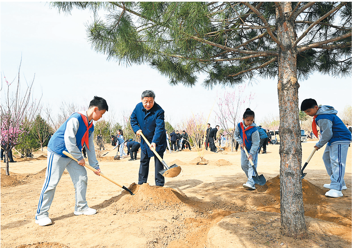
4月3日,党和国家领导人习近平、李强、赵乐际、王沪宁、蔡奇、丁薛祥、李希、韩正等来到北京市丰台区永定河畔参加首都义务植树活动。这是习近平同大家一起植树。

植树期间,习近平在场的干部群众亲切交谈。他说,目前我国森林覆盖率已经超过25%,贡献了约25%的全球新增绿化面积。经过持续努力,塔克拉玛干沙漠戴上了“绿围脖”,科尔沁沙地正重现草原风光,成绩来之不易。生态环境持续改善,人民群众感受最直接最真切。同时要看到,我国林草资源总量仍然不足,质量效益还不够高。要切实