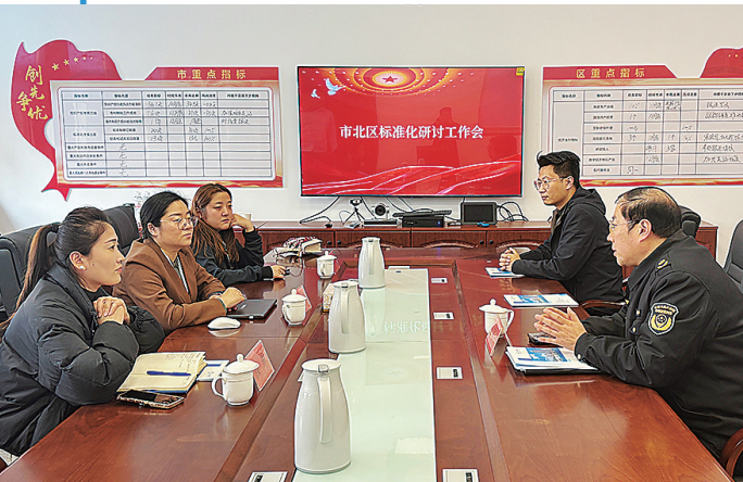
■市北区市场监管局指导企业标准化体系建设。