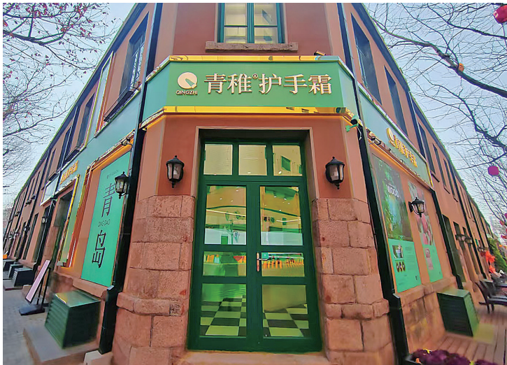
■青稚国风概念店等特色区域首店入驻大鲍岛文化休闲街区。

首发经济是提振市场活力的“强引擎”，既能促进消费端扩容提质，又能驱动生产端转型升级。2024年12月召开的中央经济工作会议明确提出，“积极发展首发经济”。市北区以入选第三批国家级旅游休闲街区的大鲍岛文化休闲街区为范本，持续引入区域或城市首家品牌店，形成消费集聚效应，激发区域经济活力。眼下，大鲍岛街区成为市北区“文旅+消费”的典范，助力首发经济聚力成势。