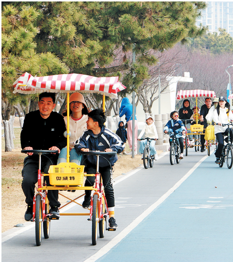
■连日来，青岛气温回升，奔赴一场骑行露营之约成了享受春光的绝佳选择。

周末，位于西海岸新区的唐岛湾海滨公园成了骑行者的乐园，海滨绿道上，市民游客或跨上单车，或租辆多人骑脚踏车，尽享一段美景与运动交织的美好时光。