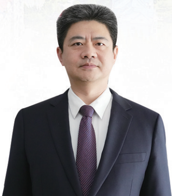
■市南区委书记王锋

目前,市南区以银川西路沿线为主,已经落地特斯拉等一批绿色新能源车企,新能源汽车销售额占到全市的20%以上,我们正在和市国企合作,规划建设数字新能源汽车产业园,未来的市南区将形成集新能源汽车生产、销售、运营等于一体的格局,成为全市智能网联汽车发展的积极推动者。