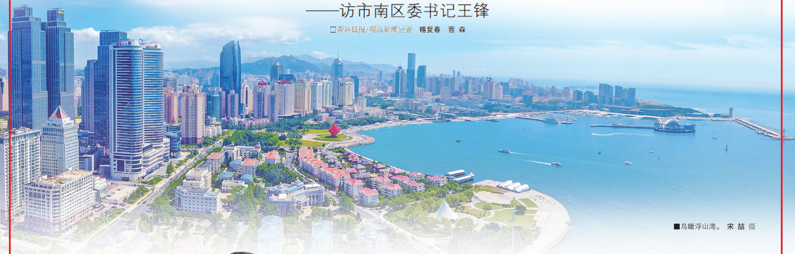
■鸟瞰浮山湾。