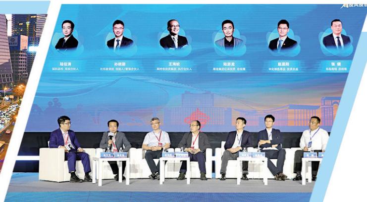
■青岛创投风投大会市南论坛。