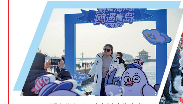
■“最美海湾 鸥遇青岛”青岛海鸥季文化旅游主题活动举办。

打造一批主题街区。引入国内头部运营商,在青岛路植入里院沉浸剧场、演艺综合体、荒岛书店、明星品牌集合店、文学主题酒店等业态,打造“青岛十二里”影视文化街区;促进劈柴院美食街区、银鱼巷年轻力街区、太兴里北区潮玩街区等品质提升,实施河北路、天津路、山西路等精品酒店集群载体改造,打造苏州路片区新质生产力产业园,激发区域人气活力。引进一批潮流业态。旅游旺季前上街里MALL、芳园里、青岛十二里、希尔顿摩庭酒店等60个重点项目开业,同步焕新顺兴楼、盛锡福等老字号品牌,新增消费场景8万平方米以上;加力开拓研学产业,构建多元化研学旅游产业体系,力争历史城区研学游接待人数增长20%。开展常态化节庆演艺。引入优质演艺资源,做好“里院喜剧节”“逛春天”“啤酒节”“赏秋天”“逛街里节”系列节庆活动策划,常态化开展“街头微演艺”等各类演艺活动,不断丰富文旅产品供给。