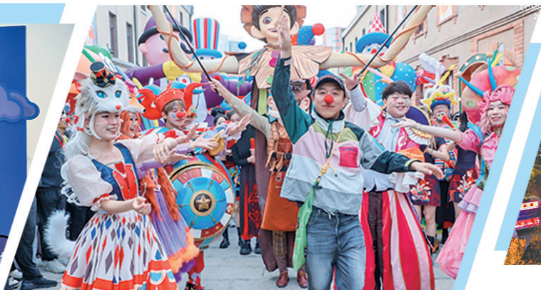
■市南打造的首届“里院喜剧节”让青岛里院圈粉无数。