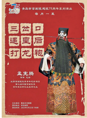
■裘派名剧《遇皇后·打龙袍》演出海报。