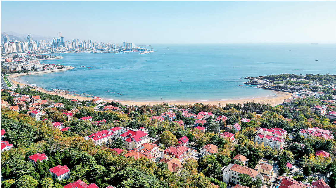
■山和海，花和树，还有那绿荫交盖下悠长的路，构成了八大关的静谧和清幽，成为闹市中少见的世外桃源。