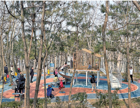
■浮山森林公园童趣园里处处欢声笑语。