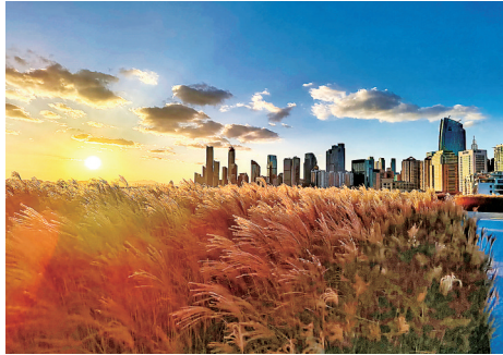
■在屋顶观赏城市的芦苇夕照。