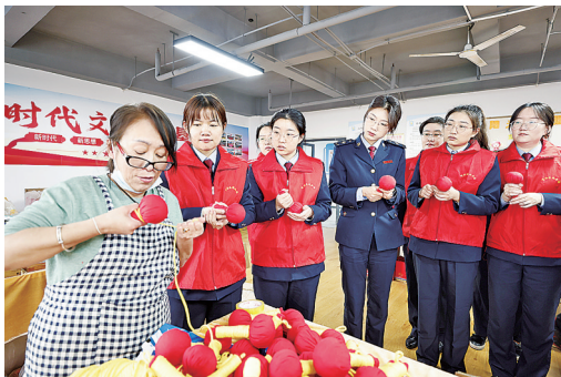
■日前，国家税务总局青岛市市北区税务局青年志愿者服务队走进市北区春南残疾人辅助就业中心，与中心的残疾朋友们共同制作和推介文创产品。图为志愿者们与特教老师一起制作手鼓锤。 刘鸿瑞/文

据介绍，原定30人的培训规模，在开放报名首日即突破50人。“北工汇智”工创夜校第二期课程涵盖知识产权与科技创新、电商直播、农民工技能提升等多领域，共21节课。夜校第二期课程不仅注重理论学习，更强调实践与创新，每个班级课程结束后，特别设置技能竞赛，以赛促学、以学促用，助力学员成为懂技术、会创新、能守业的复合型人才。 周国华 王倩倩