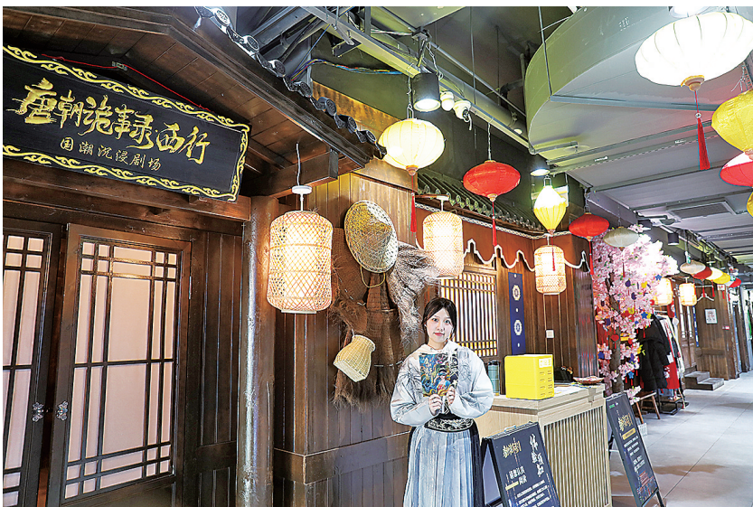
■《唐朝诡事录·西行》是岛城首家实景沉浸式VR剧场。

换上心仪古装，戴上VR眼镜，宛如置身千年前的大唐盛世；全声场环绕音响以及全感设备系统加持，一路激流勇进、俯冲飞翔，切实增强体验感。近期，市北区沉浸式文旅项目《唐朝诡事录·西行》成为人们游逛台东步行街的热门选择。在蛇年春节假期，一天最多能演24场，社交平台也不断有人分享感受，有的市民甚至“五刷”“六刷”。