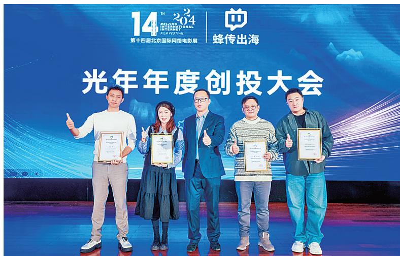
▲“市北出品”短剧《机器人女友爱丽丝》荣获“最具市场关注项目”。