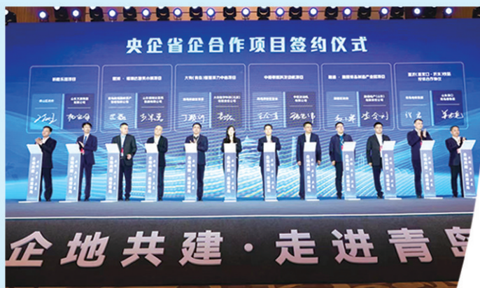
▲2024年举办的“企地共建·走进青岛”活动央企省企合作项目签约仪式现场。