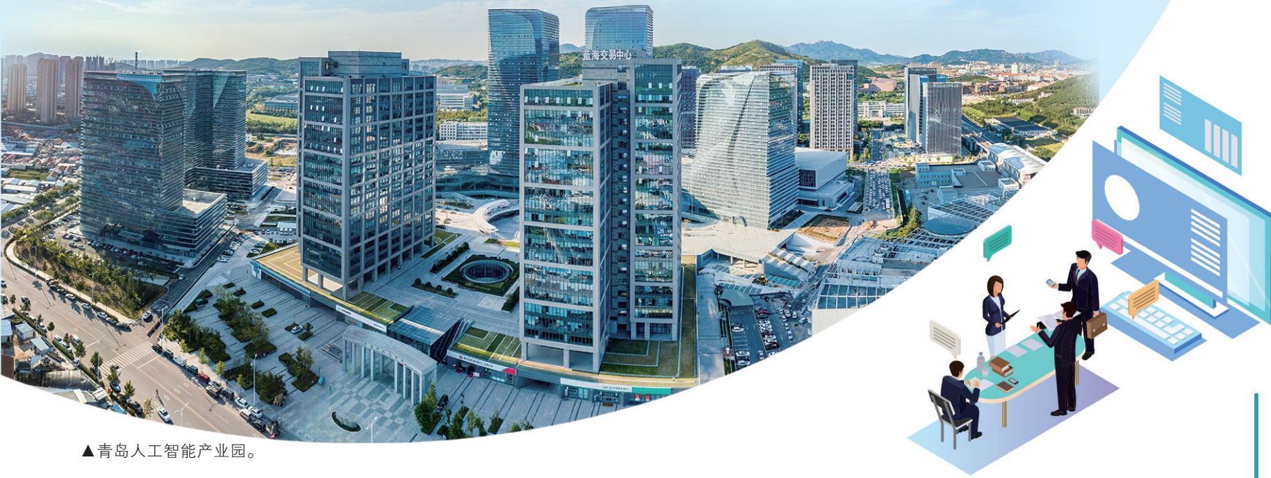
▲青岛人工智能产业园。