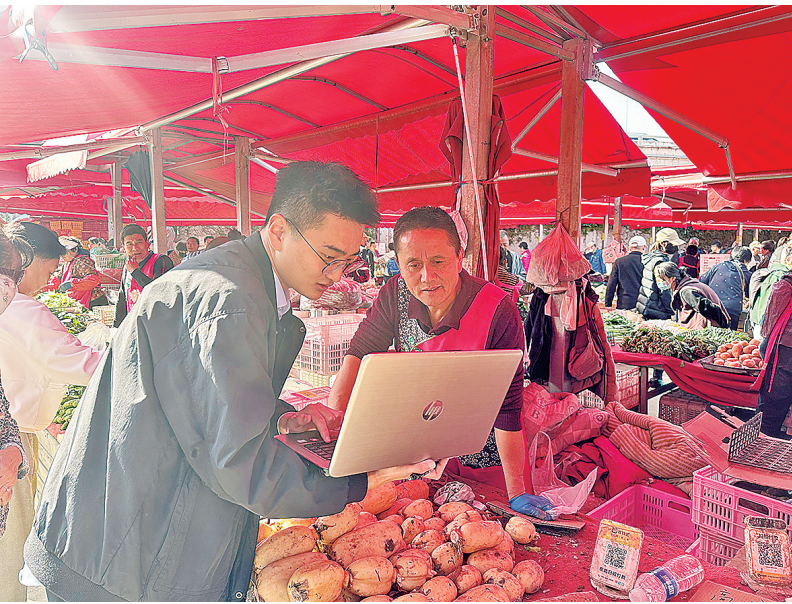
■基层审批人员为海泊河农贸市场业主“摊前办证”。