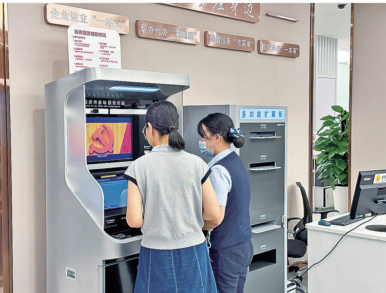
■办事人在工商银行辽宁路支行市北政银惠企示范点领取营业执照。