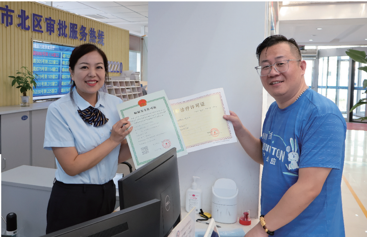
■市民在“高效办成一件事”窗口取一个号,办一串事。

东海岸电影城金地店取得了市北区自承接设立电影放映单位审批业务以来发出的第一张电影放映许可证,仅用了3小时就完成接力审批。这是市北区行政审批服务局落实“高效办成一件事”改革的一个缩影,通过减材料、减时限、增便利,推动企业信息变更“一件事”、开办餐饮店“一件事”等5项国家重点事项落地实施,创新5项市北特色集成服务,平均提速50%以上,为推动市北区“营商增效年”取得实效更添动力。