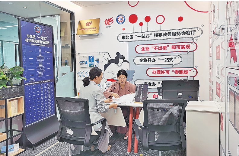
■楼宇政务会客厅服务企业“零距离”。

面向高层次人才、老年人、残疾人等,该局则提供“一对一”指导、手把手帮办、肩并肩服务,提升群众办事体验获得感。