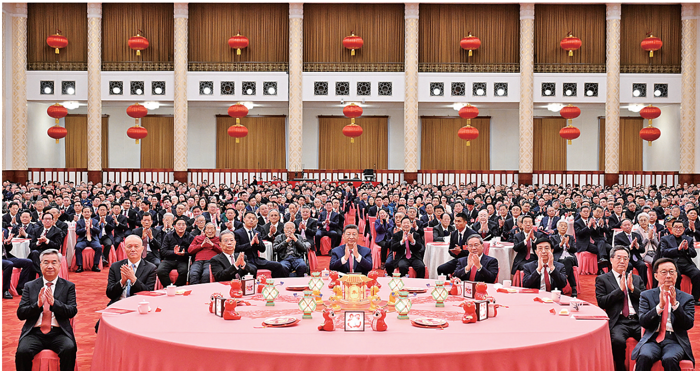
1月27日，中共中央、国务院在北京人民大会堂举行2025年春节团拜会。党和国家领导人习近平、李强、赵乐际、王沪宁、蔡奇、丁薛祥、李希、韩正等同首都各界人士欢聚一堂、共迎佳节。

新华社北京1月27日电 中共中央、国务院27日上午在人民大会堂举行2025年春节团拜会。中共中央总书记、国家主席、中央军委主席习近平发表讲话，代表党中央和国务院，向全国各族人民，向香港特别行政区同胞、澳门特别行政区同胞、台湾同胞和海外侨胞拜年。