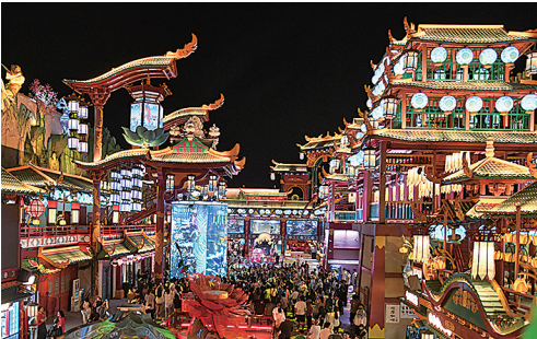
■入夜的明月·山海间美轮美奂。

坐落于城阳区的青岛明月·山海间,是青岛文旅近年来的新地标。在这里,特色文化活动不断为市民游客营造沉浸式文化体验,让这里始终保持超高人气。春节即将到来,这里的年味越来越浓。