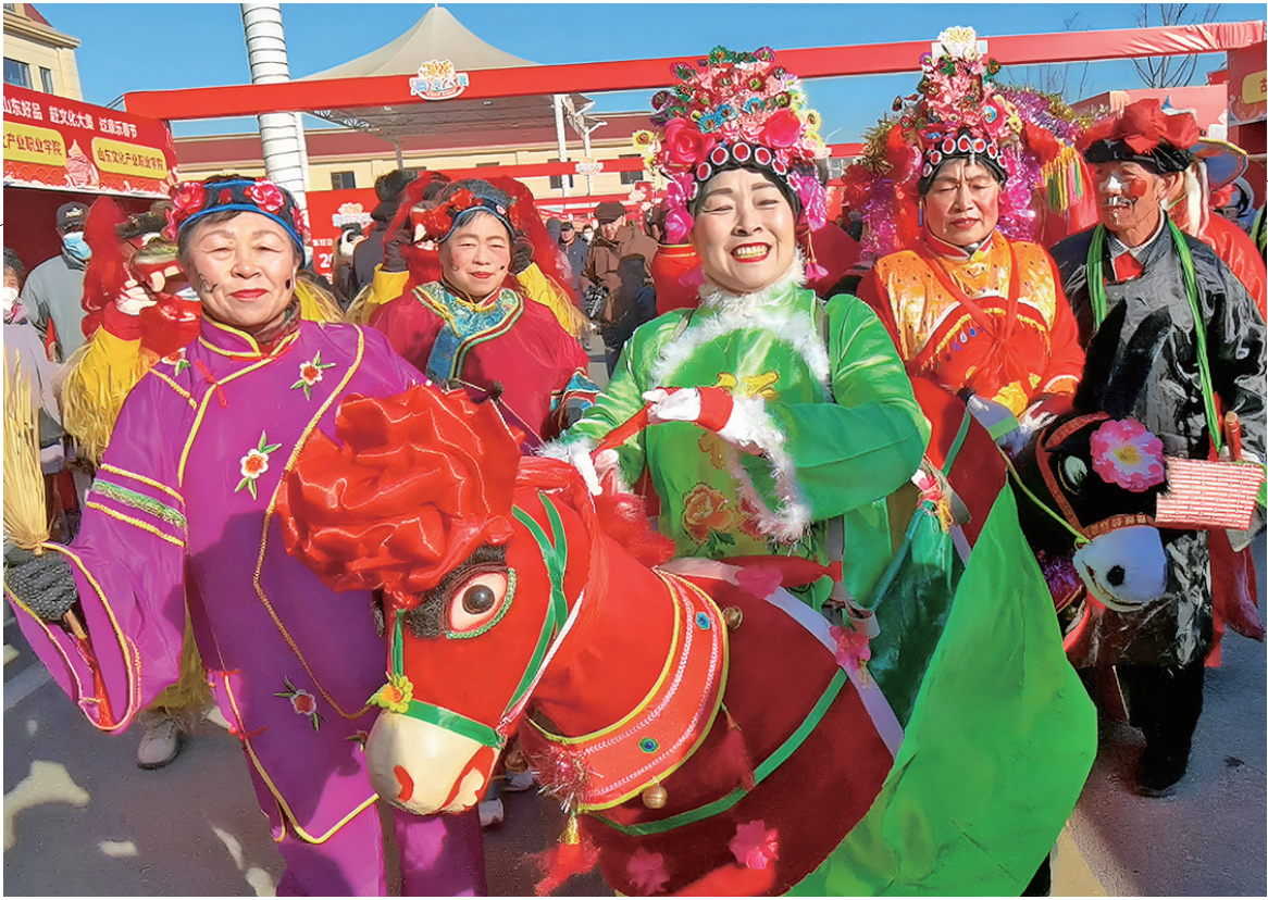
■2025山东省“海洋大集”新春季在青岛启动。

非遗展演是文化传承的重要手段之一。通过创新开展的展演活动,非物质文化遗产得以在公众面前展示,公众对传统文化有了详细了解,从而形成对非遗保护传承的有力推动。新春季活动期间,非遗“好戏连台”如“繁花”绽放,既接地气,又有新意。