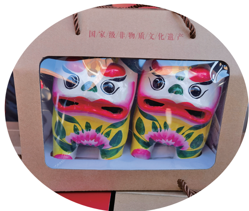
■“海洋大集”上的非遗文创产品。

非遗为线,牵绊古今。截至目前,青岛拥有各级非遗项目926项,其中国家级16项,省级85项,市级207项。持续推动非遗融入现代生活,不仅在春节,一年来,市文化和旅游局还组织开展了一系列“非遗在景区”展演展示活动,中山公园、奥帆中心、崂山风景区、大鲍岛休闲街区等纷纷组织开展非遗购物节、非遗市