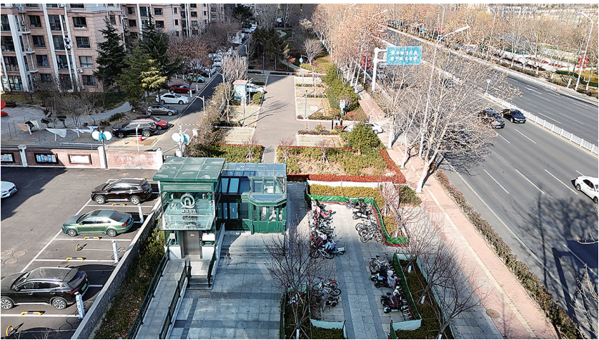
■地铁6号线九顶山站周边建设停车场，私家车接驳地铁，便利公共交通出行。

共建设停车泊位47个，充分利用了站点周边的空闲空间。记者现场看到，地铁站风亭紧邻停车场，实现私家车与公共交通的无缝衔接，不仅减少了车辆占道停放现象，也缓解了周边道路的交通压力，让出行更加高效便捷。