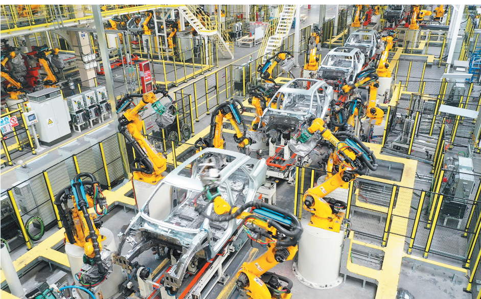
奇瑞青岛基地生产车间。

青岛汽车制造重镇即墨区近日公布了该区2024年汽车产业成绩单。分析这份成绩单,一组数据亮点突出。