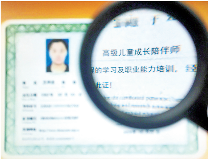
■一家中介向记者提供的“高级儿童成长陪伴师”证书。

■诉求来源 12345·青诉即办 ■观海新闻客户端“直通12345” ■党报热线82863300 ■话题热度 ★★★★★