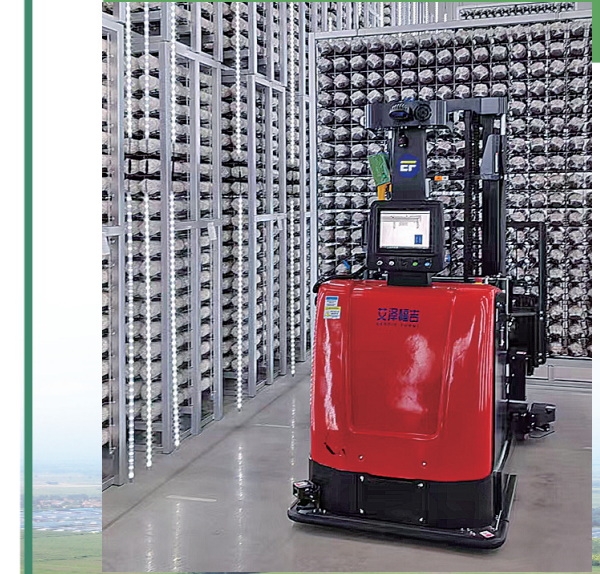
■位于莱西市的艾泽福吉菌棒培养车间内，AGV(智能搬运机器人)正在搬运菌包。

农业农村部统计数字显示，目前全国现代设施种植面积已达4000万亩，约70%的肉蛋奶和52%的养殖水产品由设施养殖提供，效率高、产出高、效益高的特点明显。同时，自主化、国产化农业设施装备体系初步形成，温室物联网技术在部分现代化设施中率先使用。这与青岛都市现代农业的“气质”相匹配，比如，设施农业的“新质”特色、集约化呈现和“链”式发展产生的效益等，青岛有基础、有实力。当前，青岛设施种植面积达52.6万亩，规模化设施养殖场2700余处、建成国家级海洋牧场示范区21处，设施农业无论在稳产保供还是在技术应用、机制模式的创新方面，均居于全国同类城市领先水平。值得一提的是，今年青岛获评全国首批现代设施农业创新引领区，全国仅5个地级以上城市整市获批。