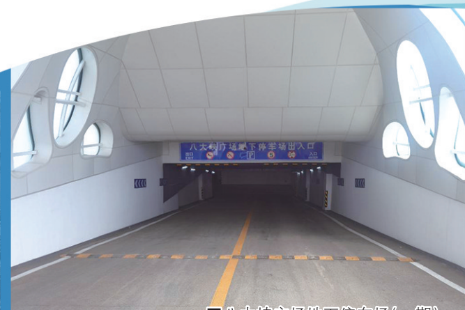
■八大峡广场地下停车场（一期）。