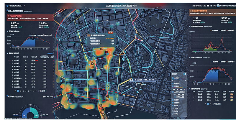
■中山路区域重大活动监测平台图。