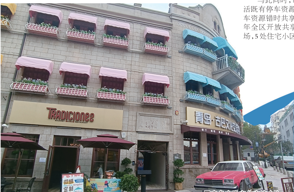
■青岛青麦文化交流中心。