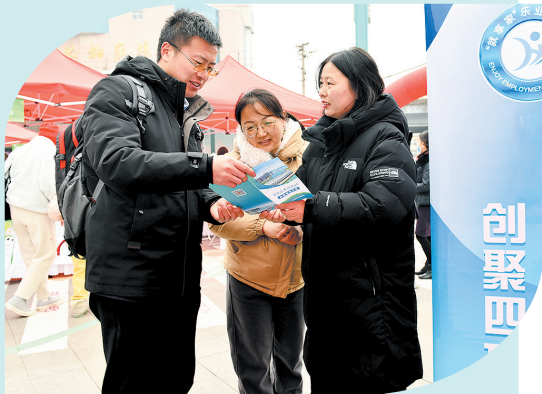
■市北区今年组织重点招聘活动105场。图为工作人员推介市北区就业政策。