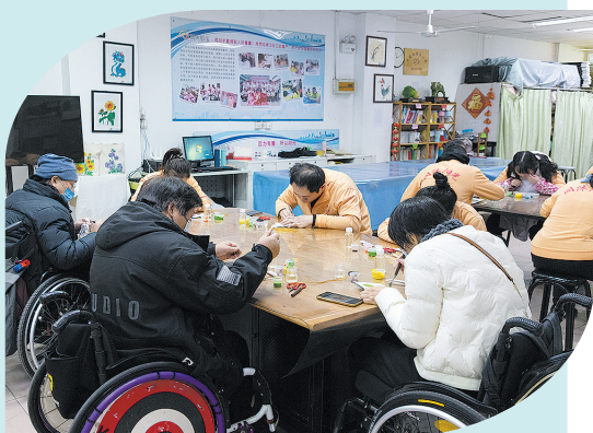
■市北区今年帮助154名残疾人实现辅助性就业。图为市北区同沐阳光残疾人辅助性就业中心开展技能培训。