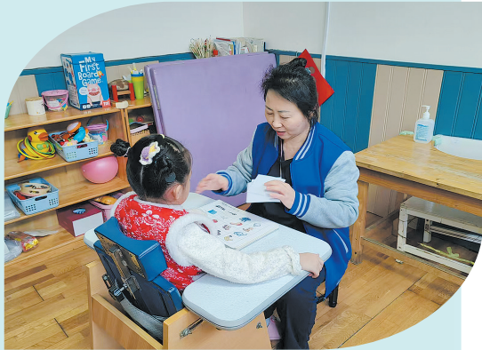
■市北区打造“医康结合、康教一体、残健融合”残疾儿童康复服务模式。

今年以来，市北区深入践行以人民为中心的发展思想，聚焦民生关切，全方位推动优质医疗资源扩容提质，不断促进高质量充分就业，进一步健全保障有力、精准救助的兜底保障体系，完善残疾人社会保障制度和关爱服务体系……通过一系列有温度、含温情的举措，在推动高质量发展中创造出更高品质的幸福生活。