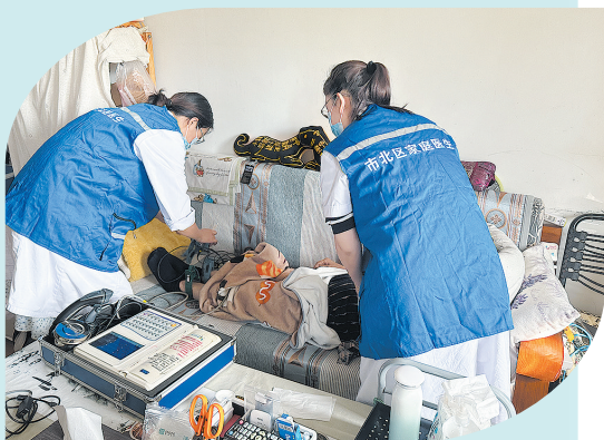
■市北区提供74项居家护理服务。图为家庭医生入户服务。