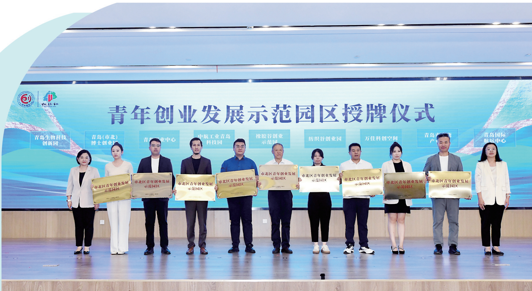
■市北区重点产业园获“青年创业发展示范园区”授牌。