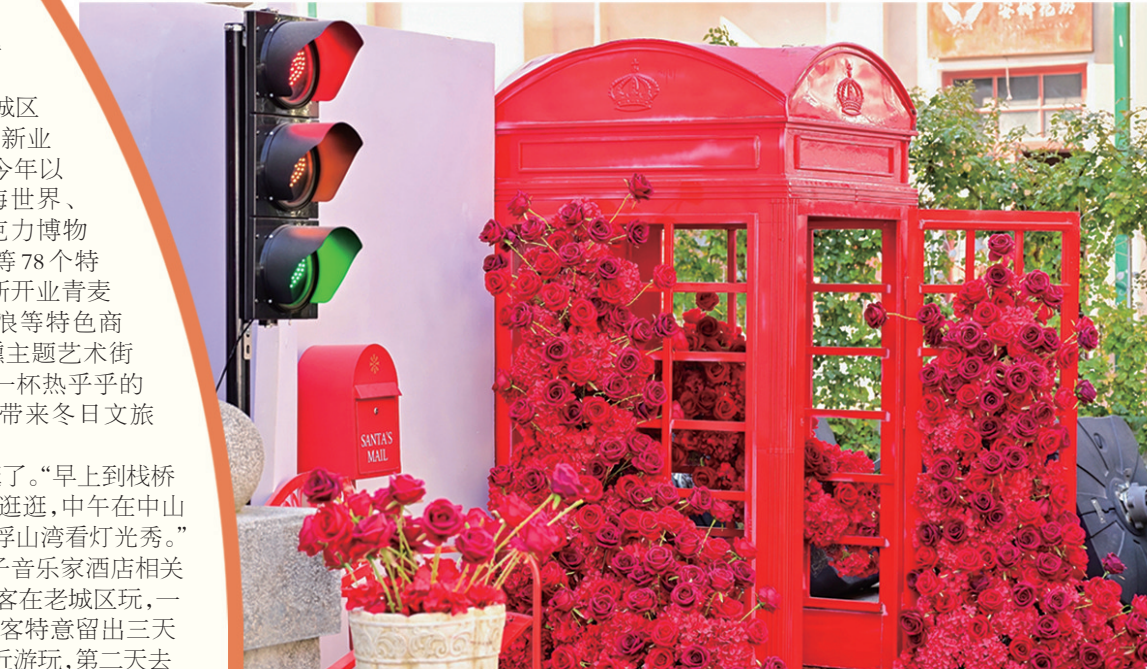
■街头随处可见的网红打卡地。