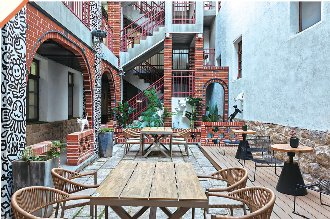
■历史街区里院民宿。