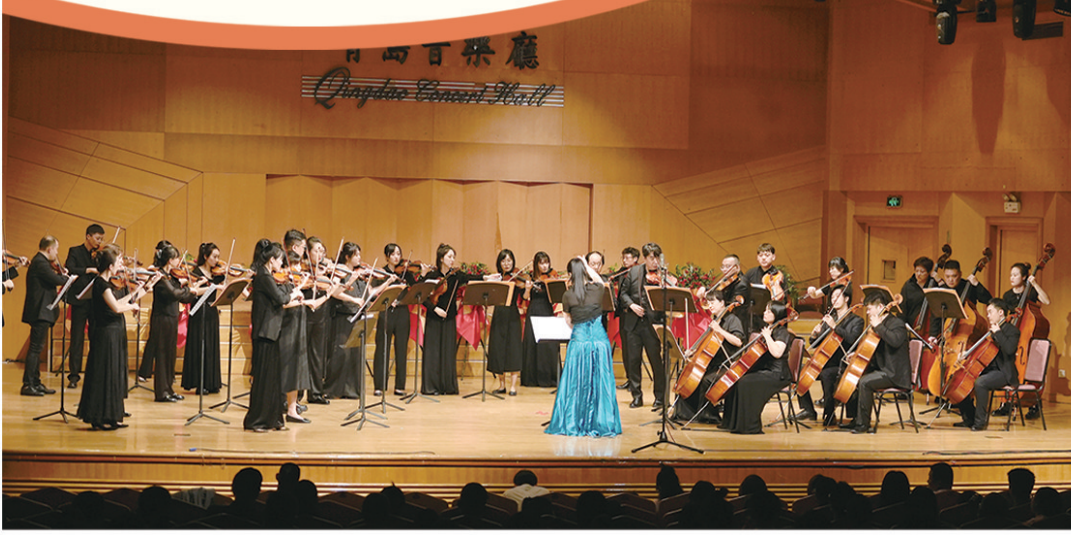
■青岛音乐厅精彩的演出。