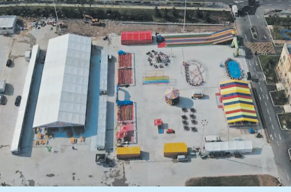
▲即墨区奥特莱斯项目违建整治前。 ▼即墨区奥特莱斯项目违建整治后。

攻坚重点片区拆后提升。坚持统筹部署、攻坚推进，坚持广泛调研、集聚民智，坚持政策支持、保障先行，将拆违治乱和“微更新”工作有机结合、一体推进，通过违建“大清零”带动环境“微改造”，以“小成本”实现了“大提升”，已完成20余个“微更新”区域，拆违5万余平方米，助力新建活动场地10余处、新增停车位300余个。