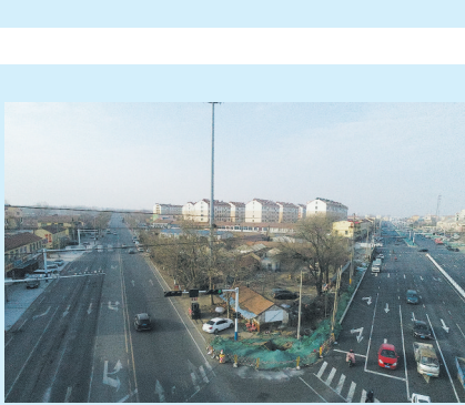
▲胶州市胶西街道陈家屯村东三角地块违建拆除前。 ▼胶州市胶西街道陈家屯村东三角地块违建拆除后。