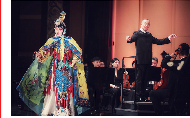
■“谭盾青岛音乐周”已成为乐坛盛事。