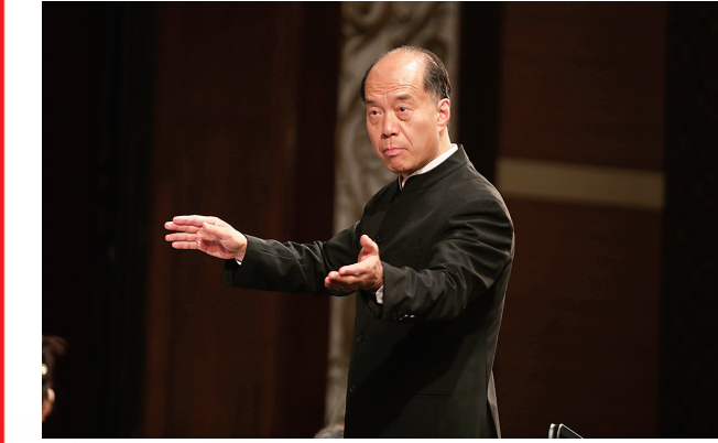
■青岛交响乐团总监、著名指挥家张国勇。