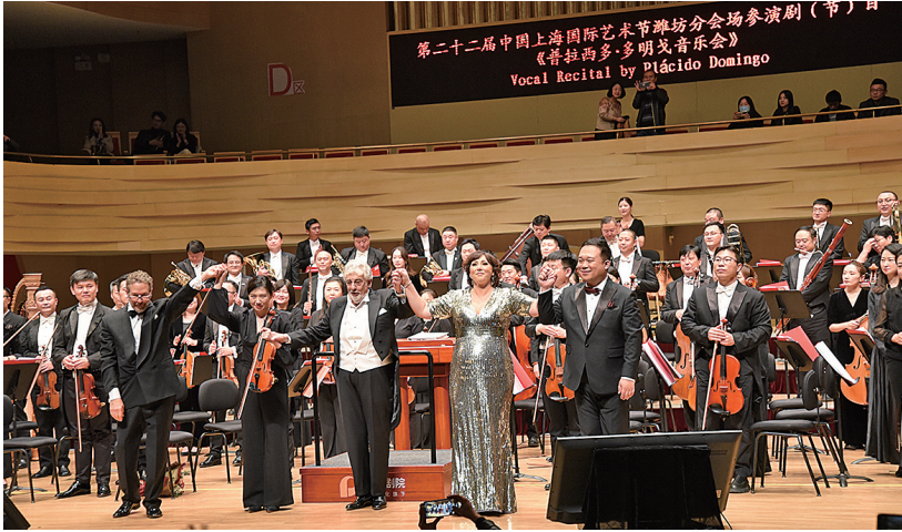
■青岛交响乐团与多明戈合作。

在营销层面,青岛交响乐团自主承接商业演出,完成“春天的交响”“西海艺术中心落成首演、ACG动漫试听