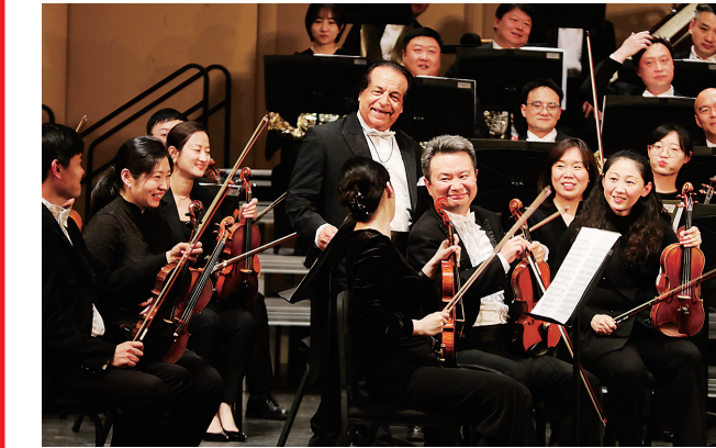
■青岛交响乐团与指挥大师亚历山大·拉赫巴里合作演出。