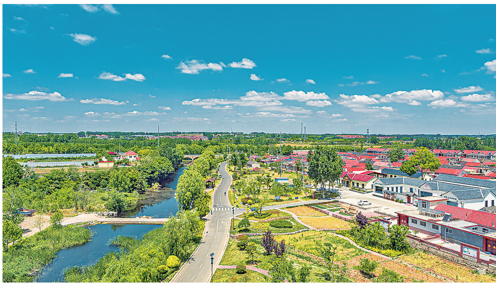
▲莲花田园示范片区内美丽乡村风景如画。

下一步,即墨区将持续推进莲花田园市级乡村振兴示范片区建设,壮大特色产业支撑,强化宣传推介,积极招引运营人才和优质项目,全面打响示范片区富民增收和生态旅游两大品牌,真正让绿水青山转化为老百姓手中的金山银山,使乡村全面振兴的底色更足、基础更牢、成效更好。