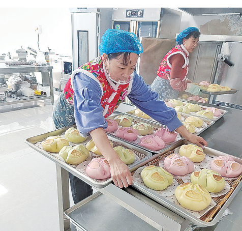
■面点小屋内,工作人员察看刚出锅的花馍。

从单一面点到粗粮馒头、老式蛋糕、福饼、枣糕等10余种面食,从只有10平方米的小房间到集加工、销售于一体占地600余平方米的专用房,从邻里之间的“熟人销售”到“线上+线下”多元化销售……位于即墨区大信街道向阳新村的青岛金谷臻禾农业有限公司自成立以来的发展就像发面馒头一样“蒸蒸日上”,日均销量200斤,月均销售额达6万余元。