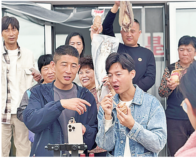
▲满贡村“网红书记”(前排左一)直播助农增收。

余名工人同样在加班加点赶工。项目落成后,这座集科普教育、自然体验、文化交流于一体的综合性设施,致力打造成华东地区最大写生基地,势必成为莲花田园片区的又一大亮点。