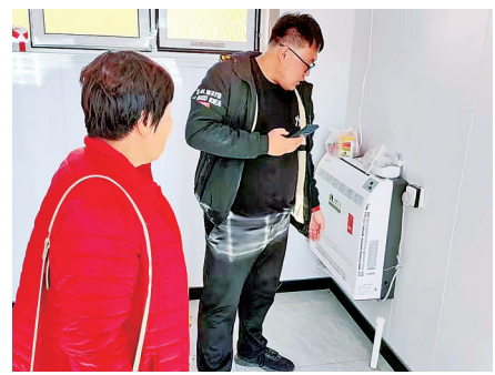
■工作人员入户了解清洁取暖设施运行情况。