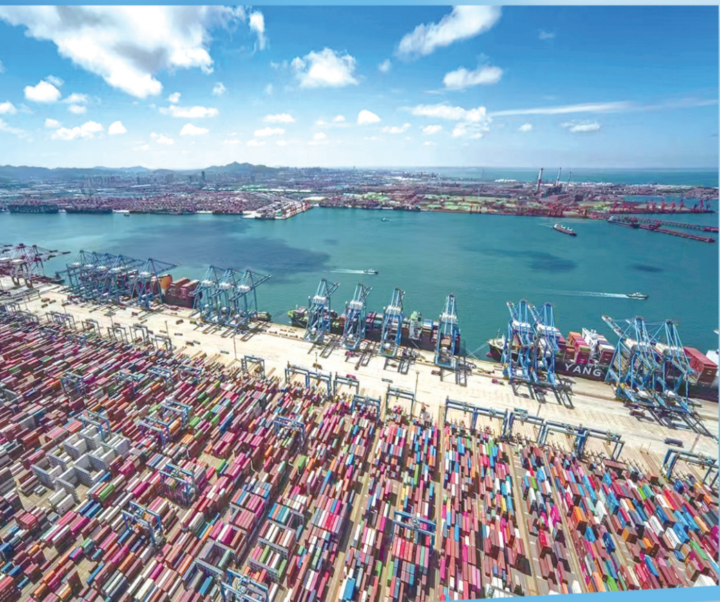
■青岛港自动化码头。