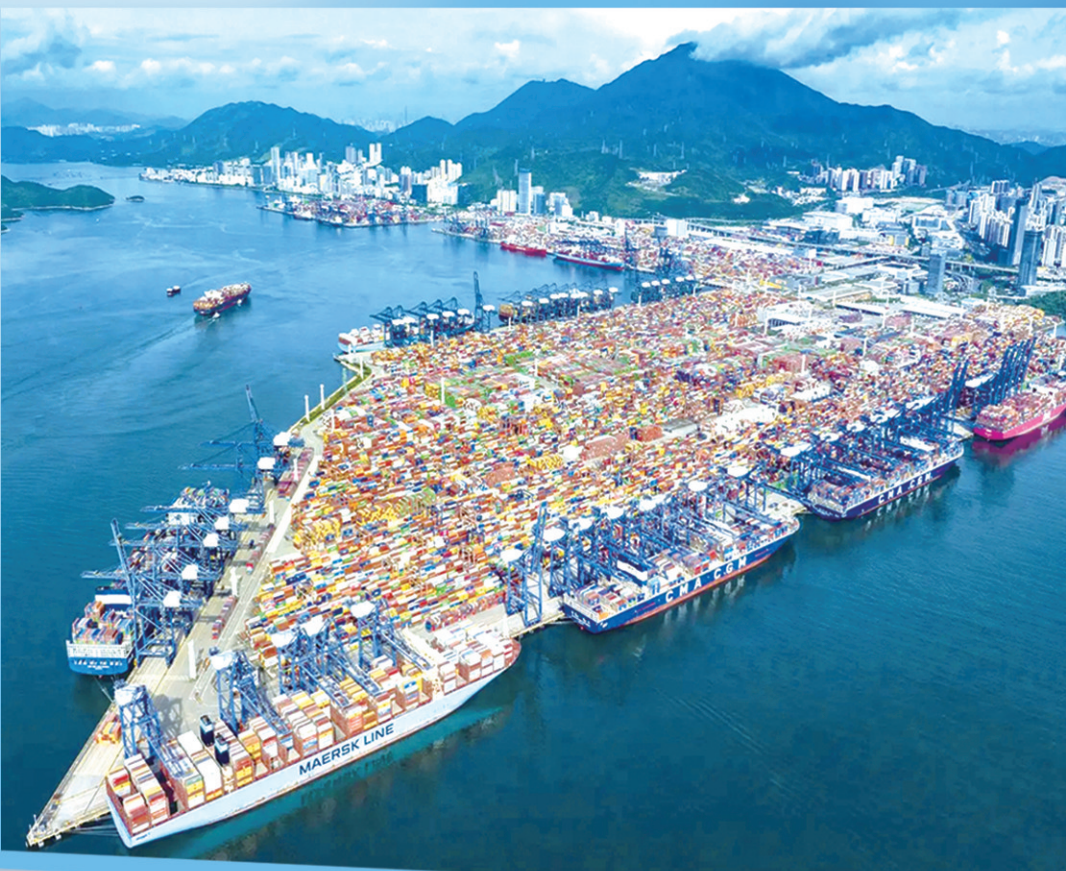
■深圳港大规模使用岸电，建设全球一流环保大港。