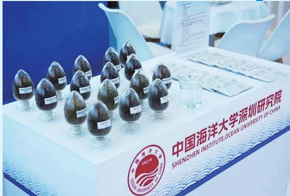
■中国海洋大学深圳研究院在高交会展示最新成果。