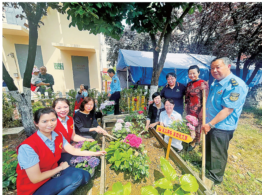
■小区建起生态花园。