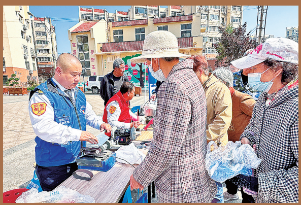
■新园小区引入 第三方资源，举 办公益服务市集。