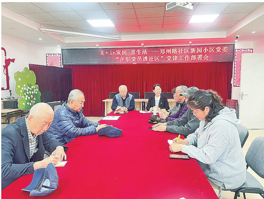
■新园小区党委召开党建工作部署会。