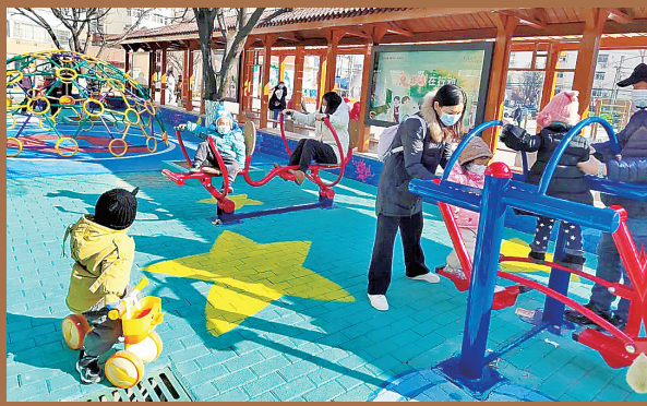
■居民带孩子 在改造后的“亲子 乐园”中玩耍。

党建聚合力，治理焕新生。洛阳路街道新园小区通过做实小区党建，实现了“组织在小区建立、资源在小区聚集、作用在小区发挥、难题在小区化解、服务在小区提供”，小区居民从过去“站着看”到现在“主动干”，小区治理的“红色引擎”已被全面点燃，居民的幸福感和获得感不断提升。