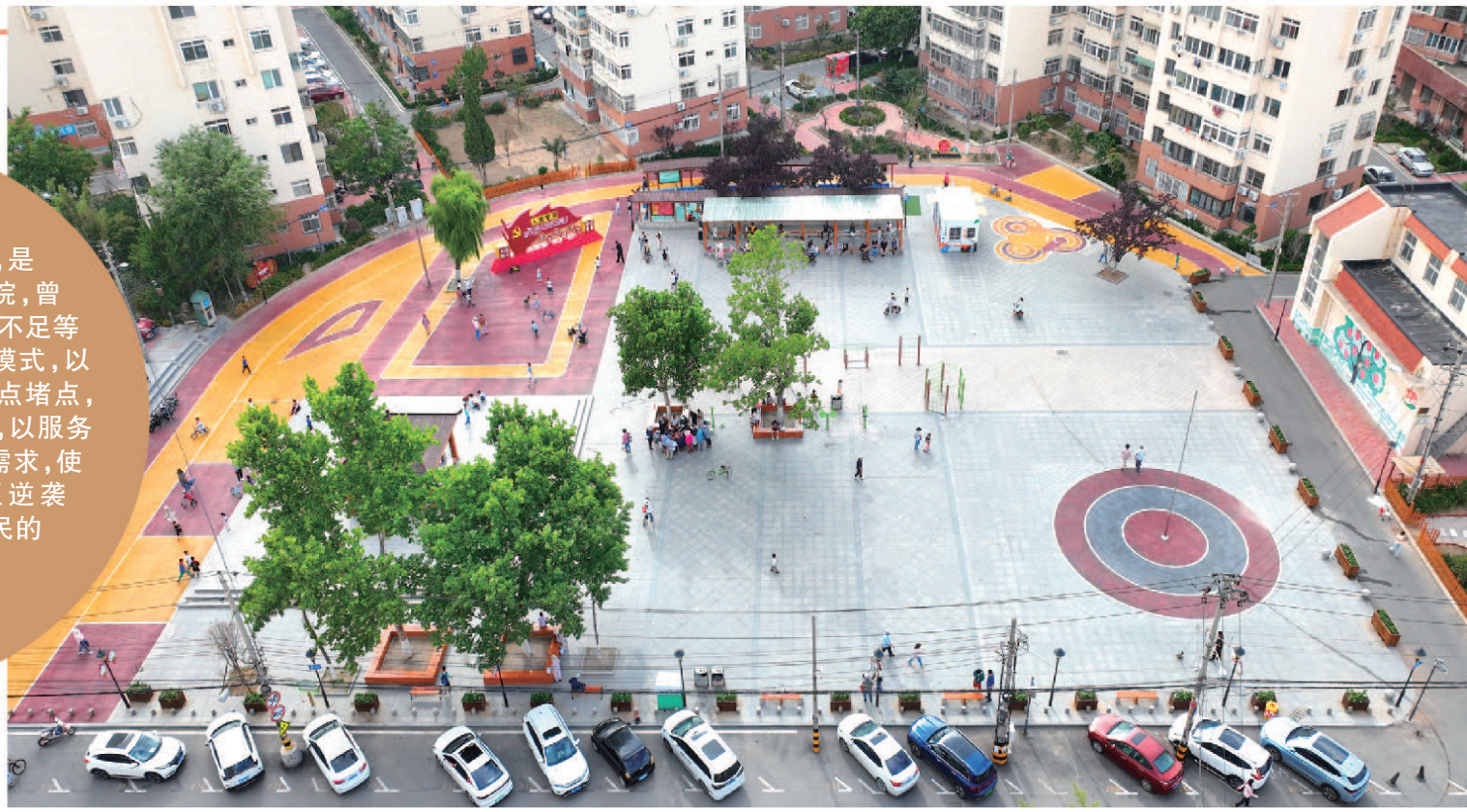
■新园小区党建广场经过改造后焕然一新。

市北区洛阳路街道新园小区始建于1994年，是一个典型的开放式老旧楼院，曾面临基础设施陈旧、服务供给不足等难题。街道开创社会治理新模式，以小区党建工作为抓手，解决痛点堵点，盘活共建资源，实行自管自治，以服务增效益的方式精准对接居民需求，使新园小区从普通老旧小区逆袭成为“生态花园小区”，居民的幸福感不断攀升。