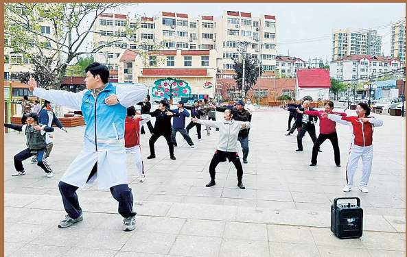
■洛阳路街道 办事处联合社区 卫生服务中心开展 养生健体八段锦 全民推广活动。