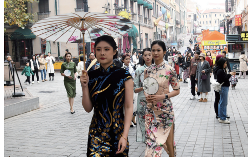
市民游客在青岛老城邂逅街头艺术。

周末的大鲍岛街区,远远听到伍佰的《再度重相逢》,接着是一首接一首的许巍、老狼、Beyond……初冬的客流汇入旋律中,街区也变得充满艺术的生活力。