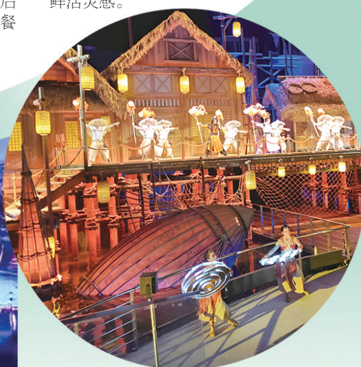
■《海上有青岛》演出现场。

尤为值得一提的是,西海岸凤凰岛艺术中心的建设,不仅面向观演观众,更将为休闲群体打开丰富体验场景,逐步呈现集娱乐休闲、打卡度假、艺术展示、互动交流、文化体育、亲子互动、文创集市七大功能为一体的全方位“艺术之湾·精神之岛”沉浸式度假艺术休闲综合体。尤其是艺术中心所处的半岛三面环海,与城市遥相呼应,旅游资源得天独厚,每一面都有成为网红打卡点的潜力。记者还探访了观海扶梯与景观屋面,唐岛湾畔的城市景观宏观地呈现于眼前,尤其是落日时分,这里成为最佳观赏点。后续,文创、咖啡复合店、美食集市、品质餐