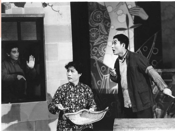
■《哥仁和媳妇们》剧照。