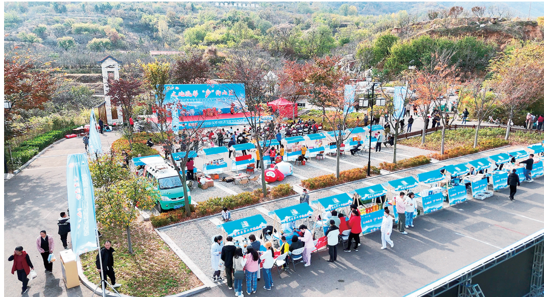
11月9日,“GO山里·享自然”杨家山里冬日旅游季活动在青岛西海岸新区拉开帷幕。

冬游青岛,最不可错过的就是山海之间的辽阔。近期,继Citywalk、Cityride之后,“捡秋”火遍全国, (下转第二版)