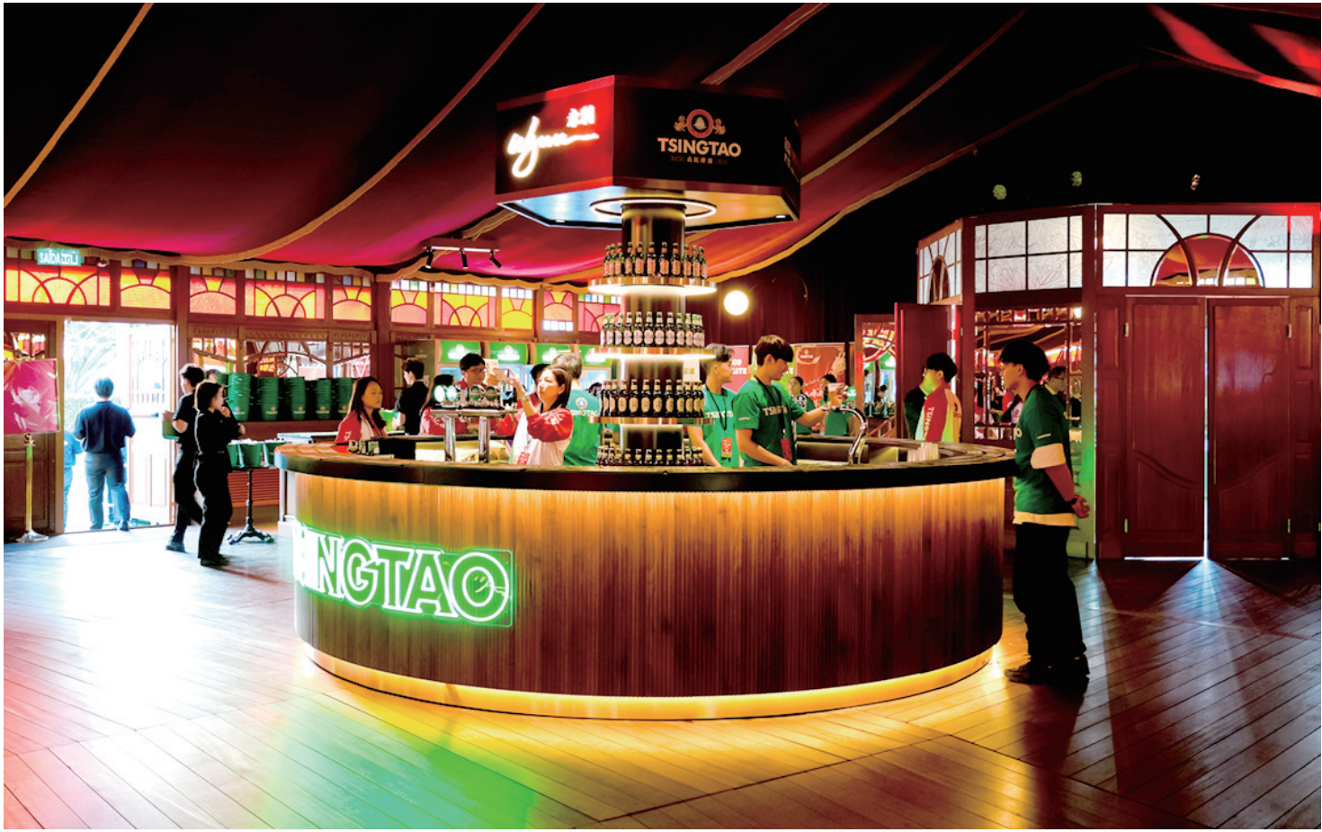
■第四届澳门青岛双城啤酒文化节暨澳门青岛周活动现场。

近年来,青澳两地在经贸、会展、文旅、教育等领域交流合作不断深化。澳门累计在青投资项目85个,实际利用澳资1.3亿美元。青澳直航作为山东唯一与澳门的空中通道,开航6年来累计运输旅客超16万人次。青岛已连续四年在澳门举办“双城啤酒节”活动,吸引澳门市民超10万人次参加。四年来,通过澳门青岛双城啤酒节及同期举办的青澳经贸合作交流会议活动,青岛各区(市)结合自身产业特点与澳门相关产业密切交流合作,近百家青岛企业和商协会与澳门建立经贸联系,“青岛啤酒”“白花蛇草水”“崂山茶”“青食饼干”等一批青岛名优商品和地理标志农产品进入澳门市场,并通过澳门走向国际市场。与此同时,一批澳门美食也由此走入了青岛市民的视野。