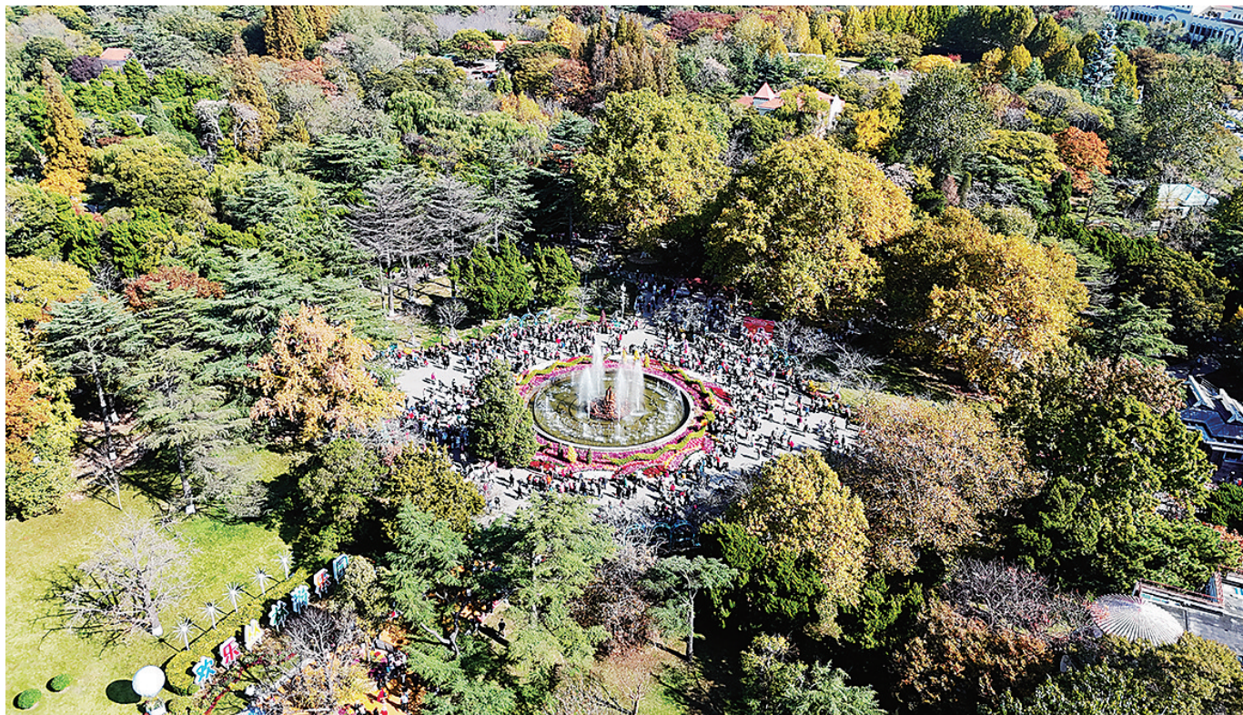
■11月3日,中山公园菊展迎来盛花期,吸引众多市民游客入园赏菊。

下一步,市园林和林业局还将举办“向园而行—倾国青成”双城相拥嘉年华活动、第二届地景艺术季等,进一步拓展“公园+”活动。