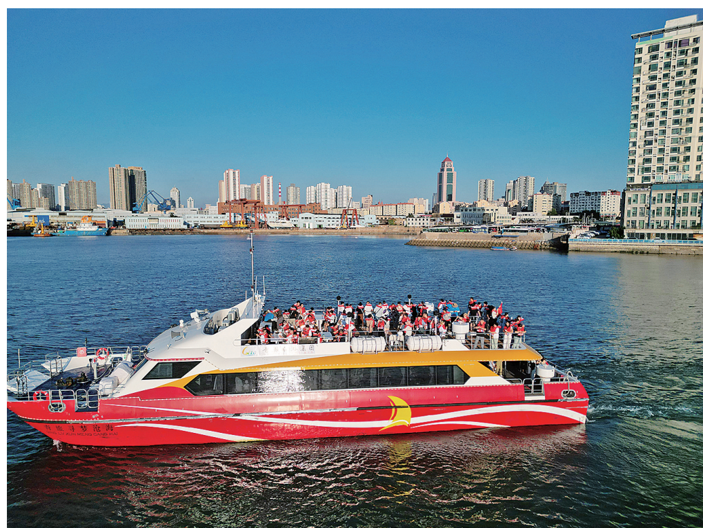
丰富的海上旅游产品,让更多的游客爱上青岛。

海面辽阔,波光粼粼。10月20日,一场帆板公开赛在青岛邮轮港区圆满落幕。选手们在海上的竞速,吸引了众多市民游客观赛。几个月来,从青岛湾轮渡码头此起彼伏的汽笛,到新兴水上运动项目的活跃,不仅体现出青岛海洋文化与滨海旅游深度融合的趋势,更展现出青岛后海作为滨海文旅新地标的独特魅力。这是青岛发力海洋文旅场景营造,提升文