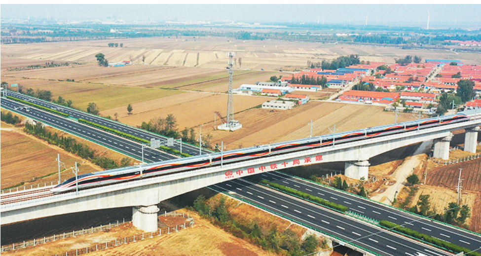
10月21日,潍烟高铁首发列车驶过昌平特大桥。

沿海地区对外交流的主要客运通道。项目全长237公里,设计时速350公里,途经青岛、烟台、潍坊3市,于2020年12月开工建设。全线设昌邑、灰埠、莱州、招远、龙口市、蓬莱、烟台西、福山、芝罘9座车站。