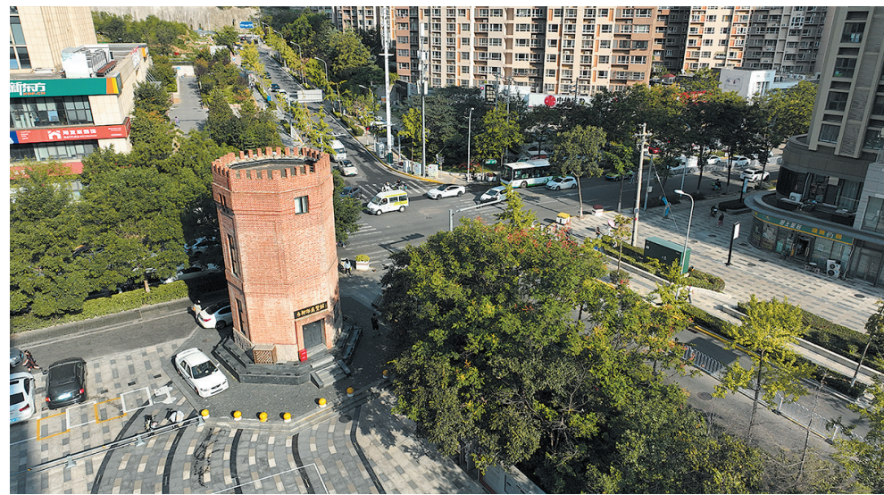
■双山水塔化身台柳路展览馆。