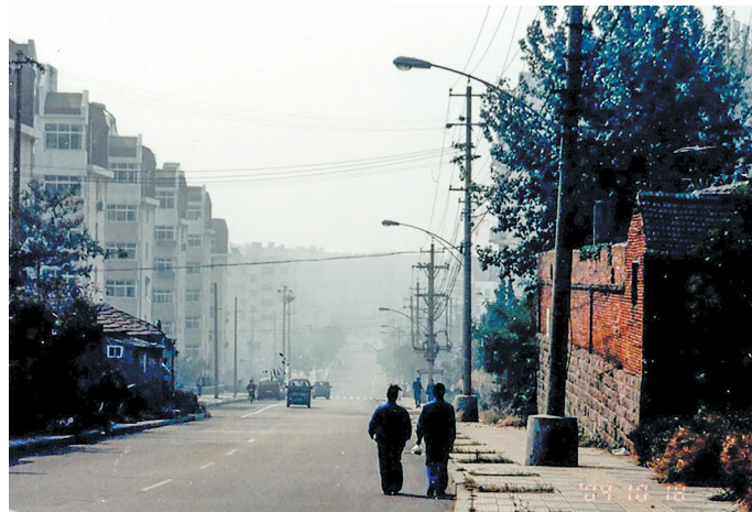
▲2004年的台柳路。 ▲改造后的台柳路。