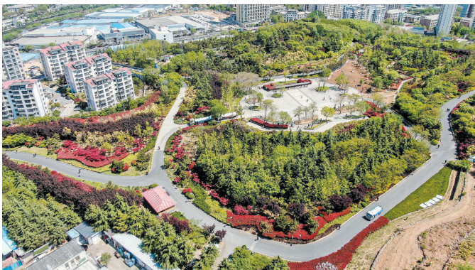
■改造后的双山公园。