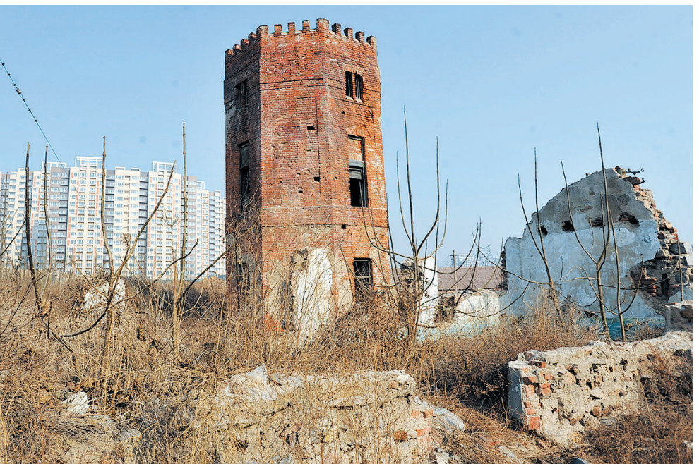
■村庄改造中的双山老水塔（摄于2009年）。