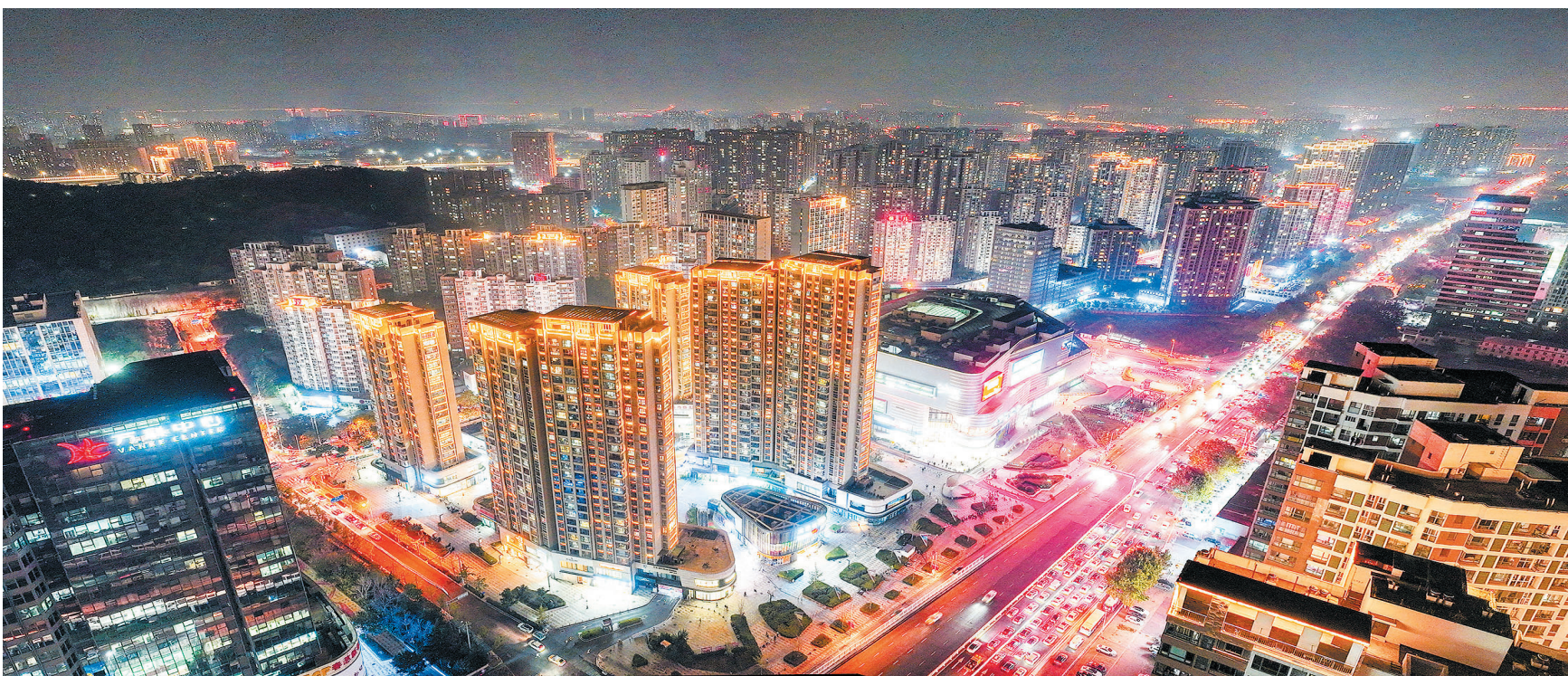
■新都心的夜晚霓虹闪烁。