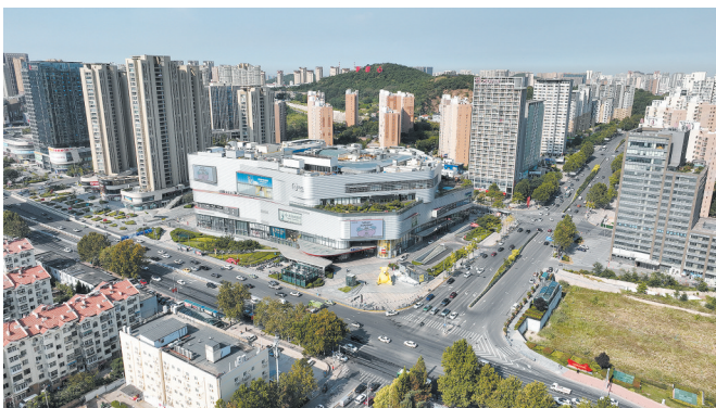
■凯德MALL是新都心的重要地标之一。