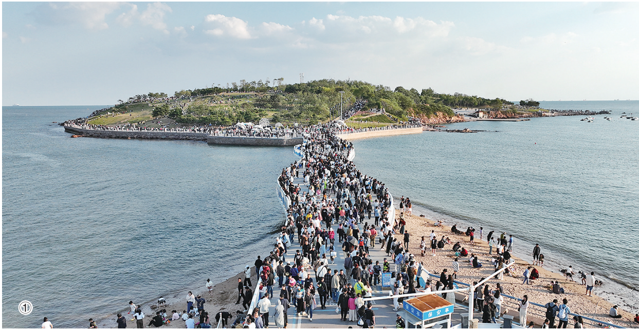
①国庆假期第二天,小麦岛公园人气火爆。大量游客有序进岛,欣赏独特的滨海风景。 ②青岛科技馆工作人员为前来“探馆”的小朋友在脸上贴上国旗贴纸,节日氛围浓郁。 ③在龙江路的不少经典机位前,游客们有序排队,争相拍照打卡。