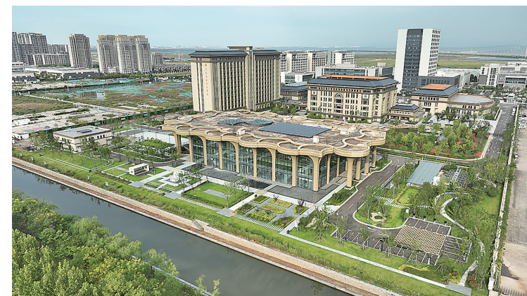
■上合组织经贸学院是具有上合特色和国际影响力的高水平大学。