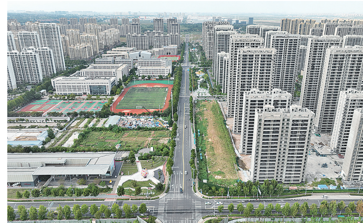
■上合示范区创新大道。