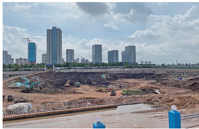
▲上合国际城如意湖总部基地项目建设场景。 (摄于2020年) ▶上合国际城如意湖总部基地启用,众多头部 企业入驻。