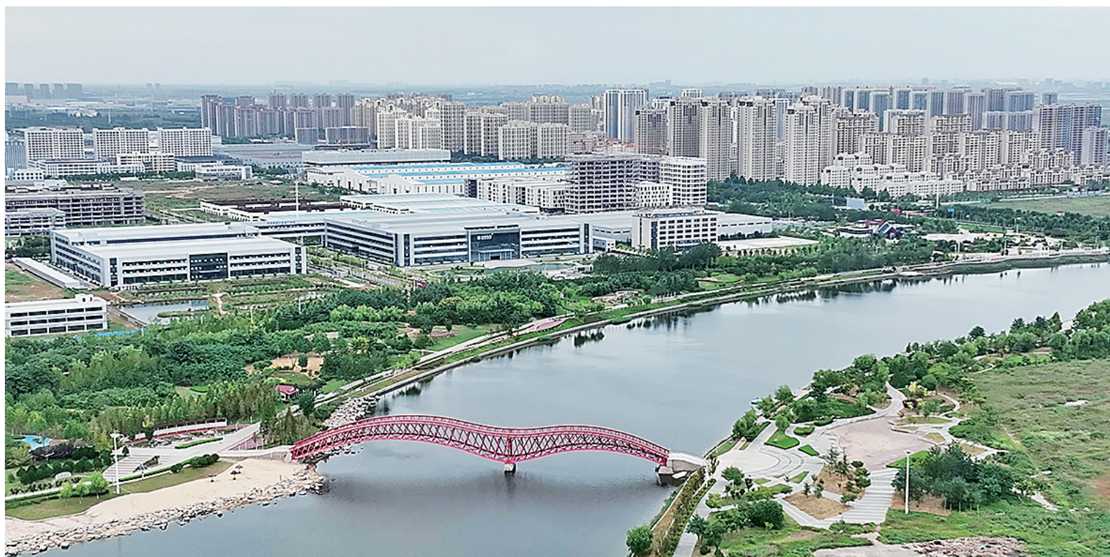
■上合示范区如意湖网红桥片区。