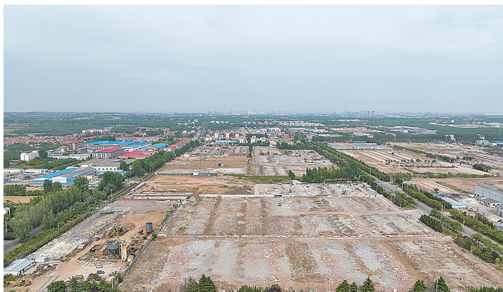
■卡奥斯工业互联网生态园项目开工。(摄于2022年)