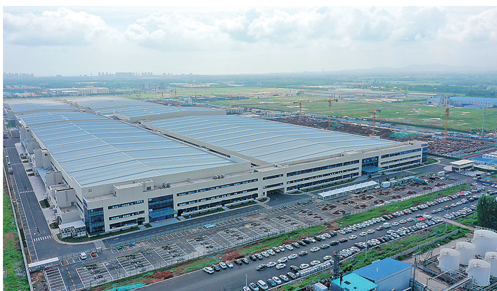
■海尔卡奥斯工业互联网生态园冰箱二期已经投产。