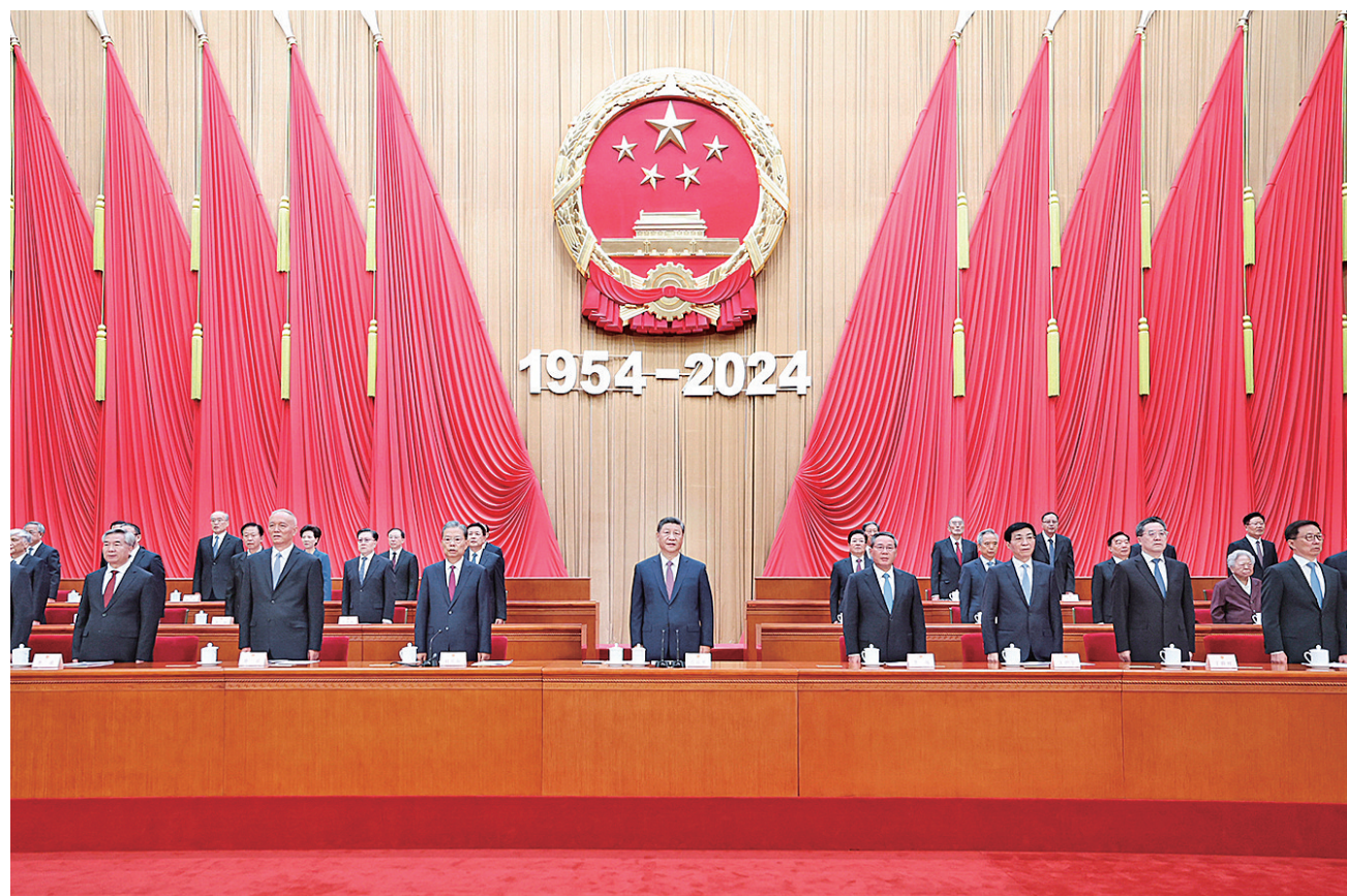
9月14日上午,中共中央、全国人大常委会在北京人民大会堂隆重举行庆祝全国人民代表大会成立70周年大会。习近平、李强、赵乐际、王沪宁、蔡奇、丁薛祥、李希、韩正等出席大会。