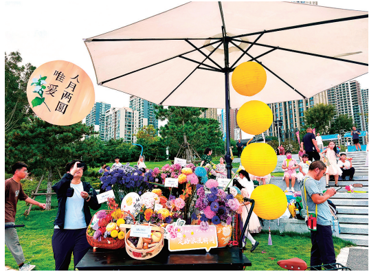
■中秋浪漫表白区引得市民驻足打卡。