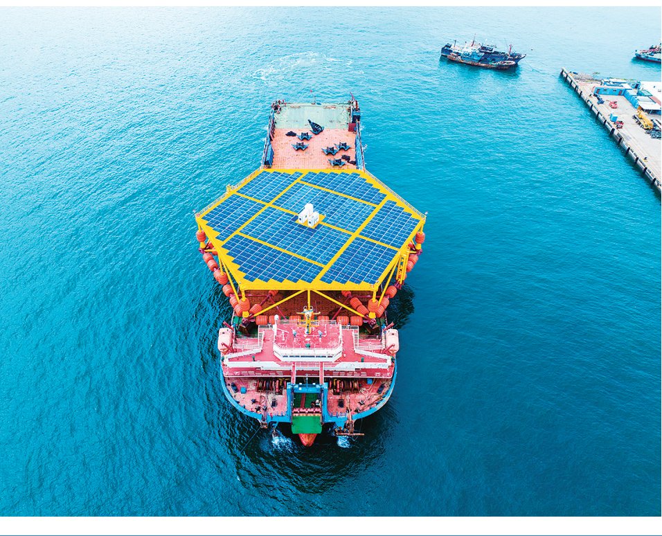
■华能“黄一”号”装船下海。

“黄一”号”下线后，将被运往华能山东半岛南4号海上风电场区域，安装在离岸30公里、水深30米的海洋环境中开展长达一年的实地监测与实验。