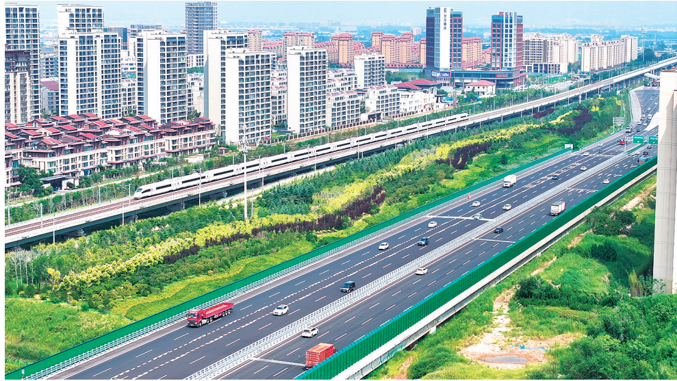
■青兰高速实施两侧绿化提升工程。图为女姑口特大桥与青盐铁路夹心地绿化景观。

而尤为引人注意的是，试点中加强了对特殊困难老年人探访关爱服务，利用群众性自治组织、基层老年协会、业主委员会、网格员、养老服务人员、社会工作者、亲属邻里等资源力量，面向独居、空巢、留守、失能、重残、计划生育特殊家庭等特殊困难老年人开展探访关爱服务。计划在2025年年底前，探访关爱服务月探访率达到100%。同时，还将培育社区“养老顾问”，为老年人提供养老服务资源转介、养老政策指导、委托代办等服务。2025年年底前，每个社区建设一支“养老顾问”队伍。