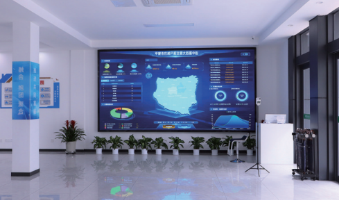
■平度市农村产权交易大数据中心。

农村集体资产产权是指农村集体产权制度改革后,股东所持有的农村集体资产股份,拥有占有、收益、有偿退出、继承、质押、担保六项权能。平度市作为第一批省级农村改革试验区,始终紧扣试验任务,大胆探索,勇于创新,深化农村集体产权制度改革,创新性构建“1+2+N”集体股份权能管理体系。通过“确权”明确产权归属,“赋权”保障农民合法权益,“活权”激活农村资源要素,强化了集体股份的管理与监督,激发了农村集体经济发展的内在活力与潜力,为乡村振兴注入了强劲动力,促进了农业增效、农民增收、农