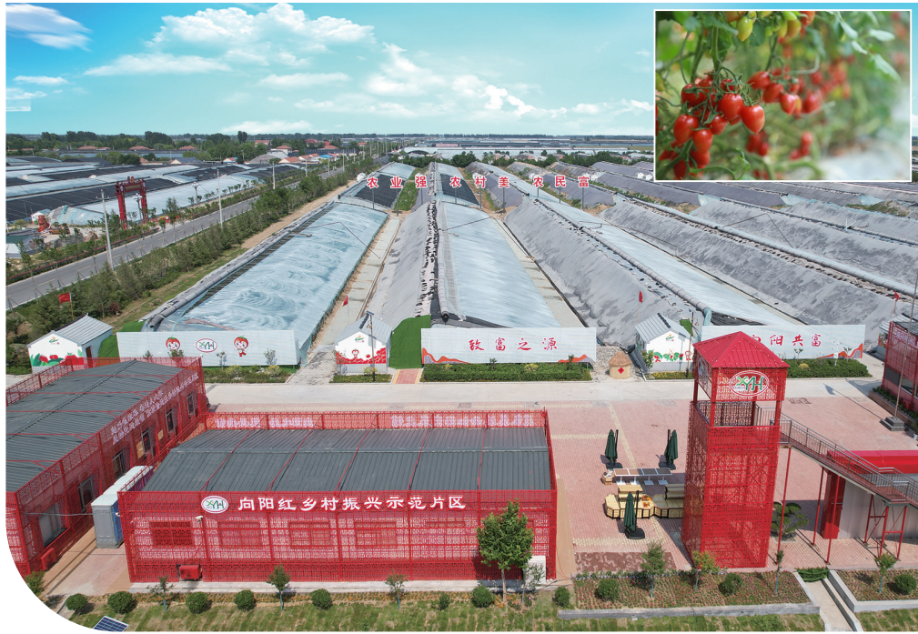
■崔家集镇向阳红乡村振兴示范片区一角。

党的二十届三中全会指出,城乡融合发展是中国式现代化的必然要求。必须统筹新型工业化、新型城镇化和乡村全面振兴,全面提高城乡规划、建设、治理融合水平,促进城乡要素平等交换、双向流动,缩小城乡差别,促进城乡共同繁荣发展。平度市深入学习贯彻党的二十届三中全会精神,坚持农业农村优先发展,通过深化产权制度改革、探索宅基地制度改革、统筹示范片区建设以及搭建资源交易平台等措施,积极推动城乡融合发展,全面推进农业农村现代化。