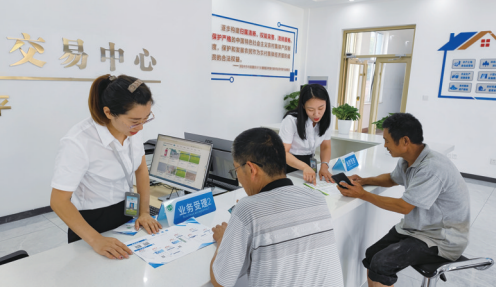
■农交中心工作人员为村民办理产权交易业务。

前一阶段,平度市南村镇沽韵新村决定将低效土地统一流转,提升土地价值、增加农民收入,于是积极寻求专业指导,并咨询了平度市农村产权交易中心(简称“农交中心”)。农交中心为沽韵新村提供了详尽的政策解读、市场分析以及流转流程指导,该项目顺利进入在线竞价环节,竞价过程紧张激烈,经过多轮竞价,最终以1051