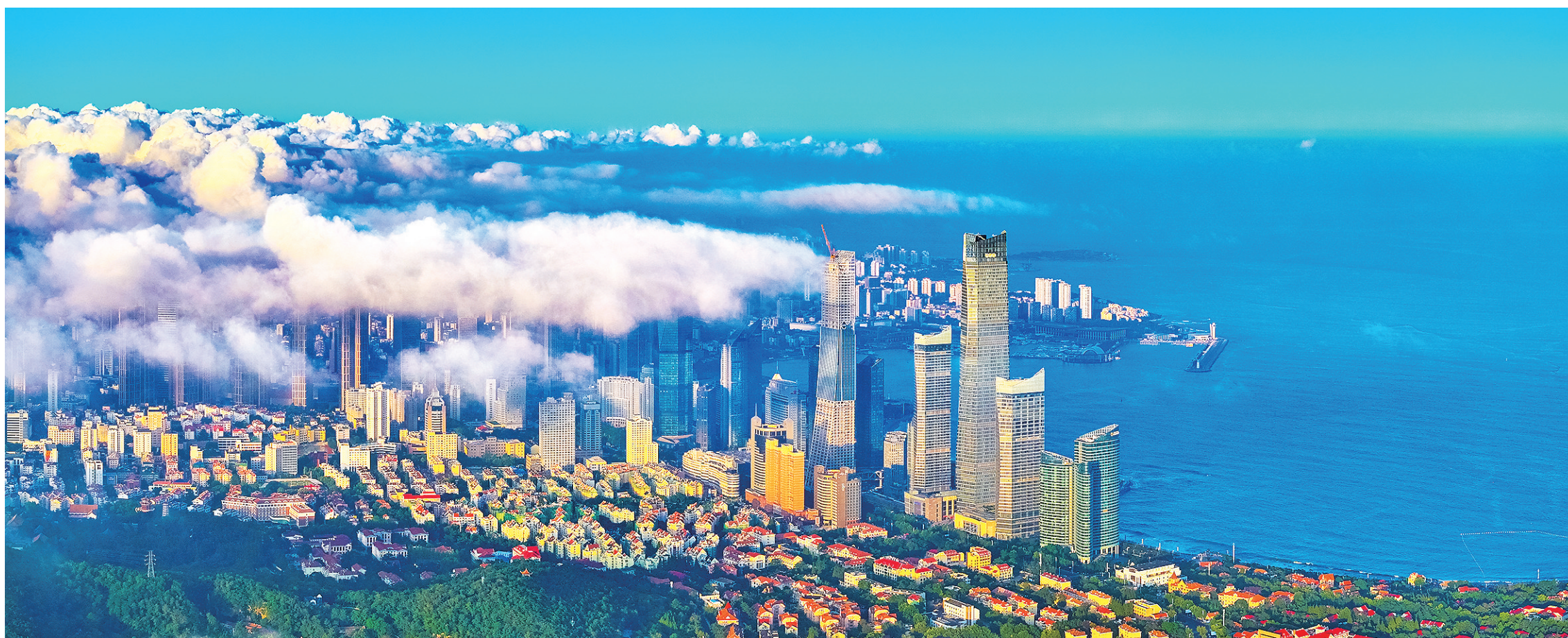
■《远眺海天》