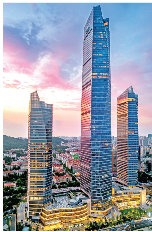
■《晚霞海天》