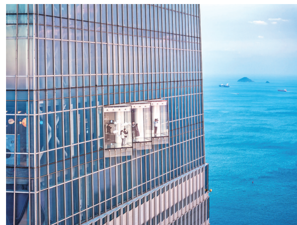
■《青岛之窗》