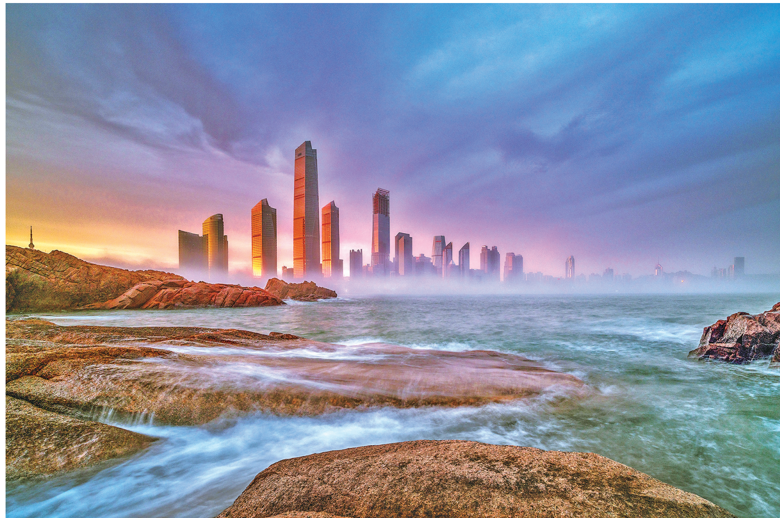
■《梦幻滨海暮色》