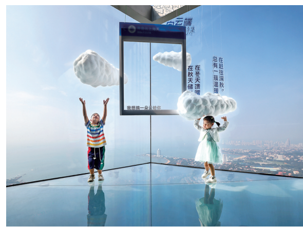
■《为你摘下一朵云》