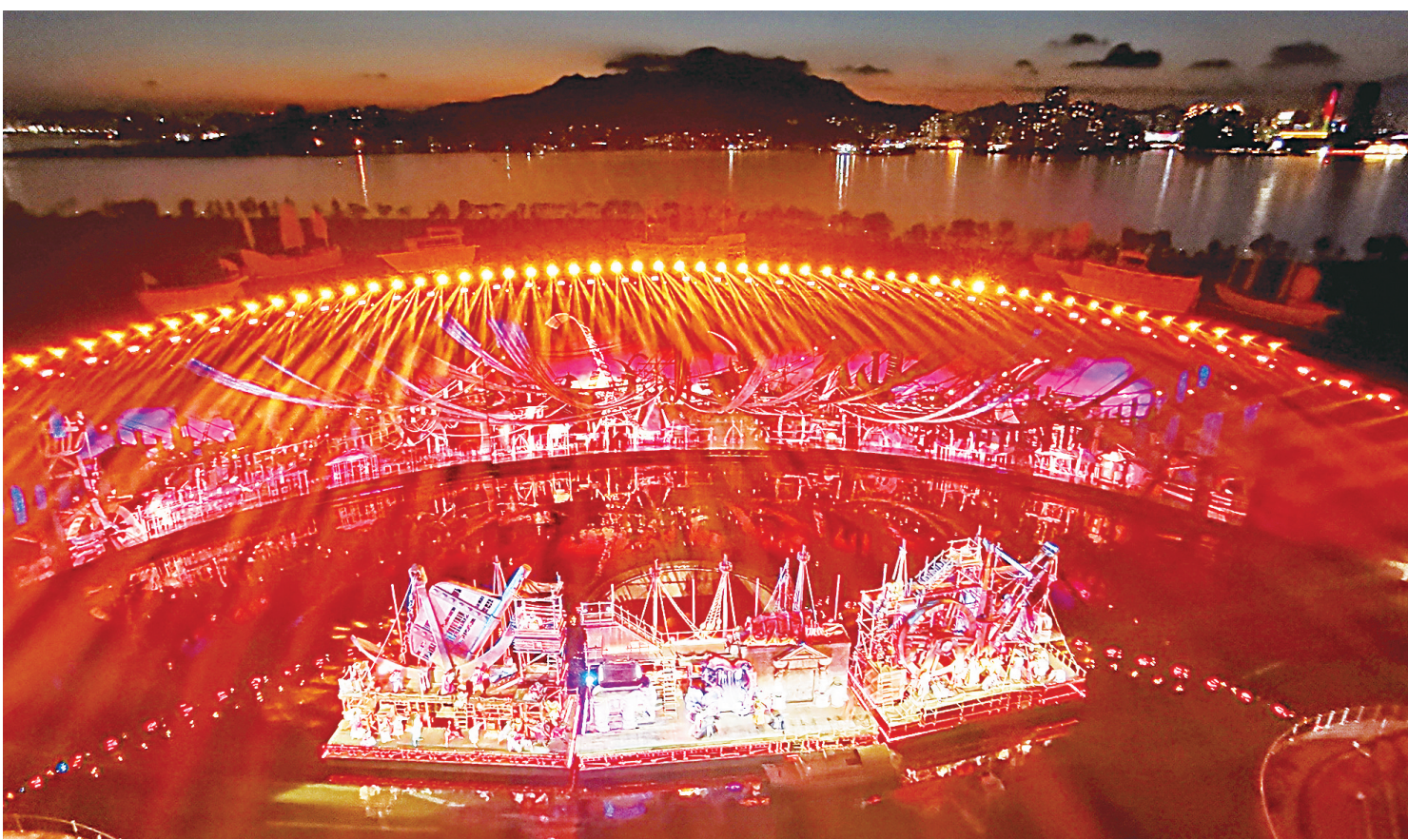
西海岸凤凰岛艺术中心推出360度全景秀《海上有青岛》。