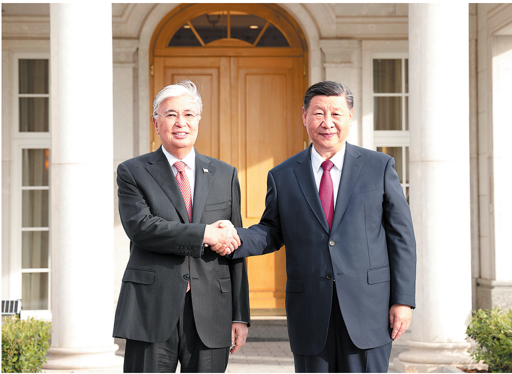
当地时间7月2日晚,国家主席习近平应邀同哈萨克斯坦总统托卡耶夫共进晚餐,在愉快温馨的环境中就中哈关系和共同关心的问题进行了亲切友好的交流。这是习近平同托卡耶夫握手。