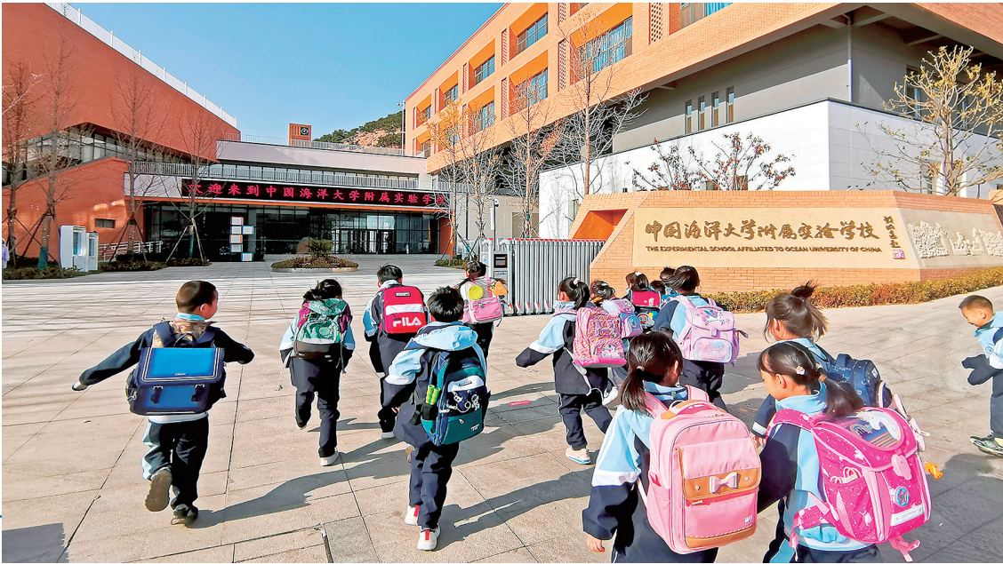
■中国海洋大学附属实验学校建成投用。(资料图)

免费理发摊位前,剪刀与梳子的交响曲此起彼伏;趣味等级比赛现场,邻居们欢聚一堂;不远处的特色摊位上,手工艺品、家庭美食琳琅满目……6月18日下午,位于中韩街道高科园一小区的2024年崂山区邻居节开幕式现场,呈现出一片百姓安居乐业、社会和谐稳定的气象。 中国式现代化,民生为大。发生在邻居节上的这一幕幕温馨而又和谐的场景,正是崂山区将改善民生放在工作首位,持续提高人民生活品质的生动缩影。 站在时间的坐标轴上回望,崂山区建区以来,始终把保障和改善民生作为一切工作的出发点和落脚点,持续在群众关注的教育、医疗、体育、养老、文化等公共服务领域加大投入力度,幸福生活质感十足。站上建区30周年的新起点,崂山区民生工作亦翻开崭新篇章——崂山区第一中学、午山中学、瑶海路幼儿园等学校建设如火如荼,崂山区人民医院、山东中医药大学附属医院青岛医院提速推进……在城市发展与民生福祉的交相辉映中,崂山区民生答卷上幸福感满满。