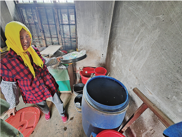
■莱西市南墅镇姚沟村一村民家中摆放着多个盛水的大桶。

村,多年前就建设了自来水管网,由村东北角的水井和泵房设施供水。但由于水泵压力和水量不足,只有住在村北的村民能用上自来水,村南村民常年用不上自来水。去年年初天旱,水井缺水,村里每天限时供水。去年5月,水泵彻底抽不上水来了。此外,老管线漏水失修也是至今无法正常供水的原因。