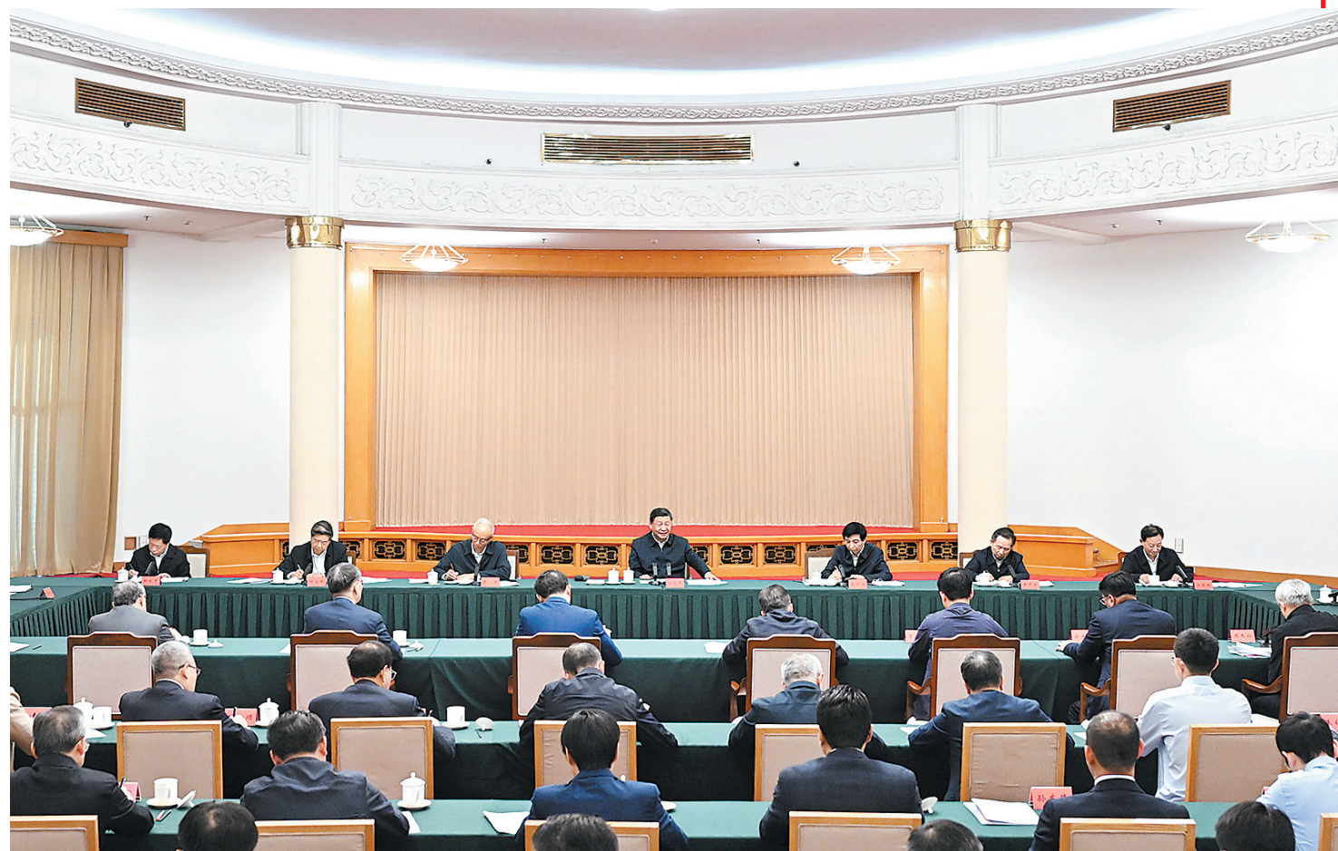
5月23日下午,中共中央总书记、国家主席、中央军委主席习近平在山东省济南市主持召开企业和专家座谈会并发表重要讲话。

新华社济南5月23日电 中共中央总书记、国家主席、中央军委主席习近平5月23日下午在山东省济南市主持召开企业和专家座谈会并发表重要讲话。他强调,党的二十大擘画了全面建设社会主义现代化国家的宏伟蓝图,确立了以中国式现代化全面推进强国建设、民族复兴伟业的中心任务。进一步全面深化改革,要紧紧扣住中国式现代化这个主题,突出改革重点,把牢价值取向,讲求方式方法,为完成中心任务、实现战略目标增添动力。