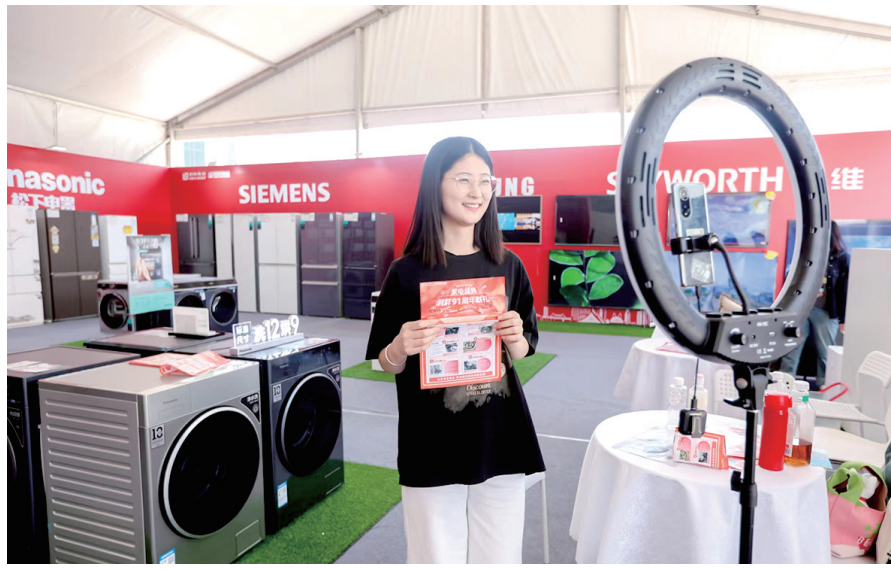
▲以旧换新促销活动现场，知名品牌开展现场直播。