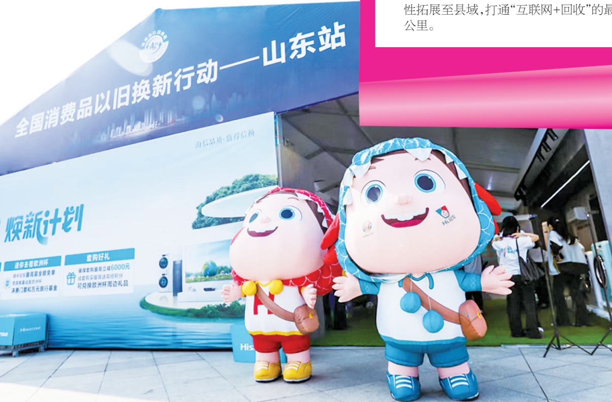
▼全国消费品以旧换新行动——山东站活动现场海信展区。