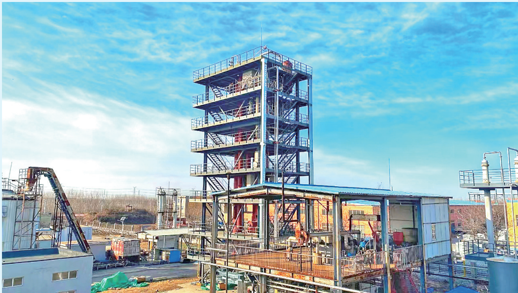
■生物质化学气制绿色液体燃料中试平台建成。

高校、科研院所本就是前沿成果的产出地,鼓励其开展“就地转化”可缩短成果落地的过程。为此,青岛出台了《在青高校服务地方活力绩效评价推动产教深度融合实施方案》,从科教产融合、科技成果转化等多个维度首次对在青高校开展综合绩效评价,并予以分类支持。去年10月,山东大学(青岛)、中国海洋大学、中国石油大学(华东)等22所在青高校的50个学科专业获批立项建设产教融合示范学科专业,中石大软件工程、青岛大学临床医学、山东科技大学新能源科学与