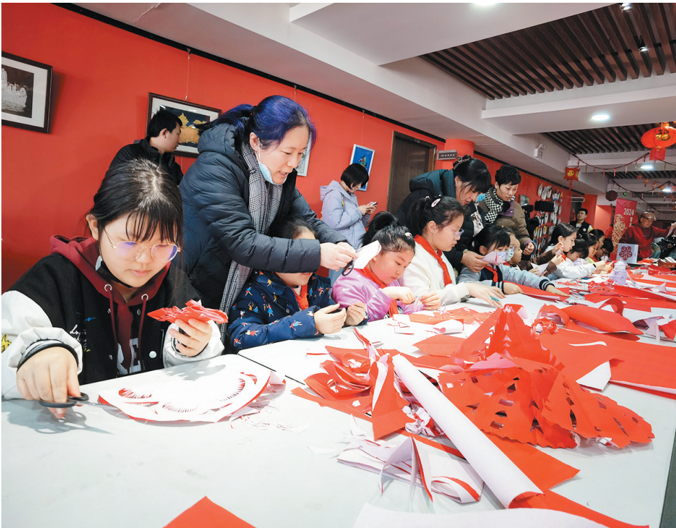
■孩子们在岛城剪纸艺术家指导下学习传统剪纸。

会，“馆长带您‘走近老舍’”和“走近老舍”公益诵读课堂等一系列深度研学，在青岛骆驼祥子博物馆等场所展开。青岛第七中学7年级5班的同学自发组成学习小组，围绕七年级下册必读书目《骆驼祥子》，策划参观了骆驼祥子博物馆、品读老舍先生著作的研学之路，在沉浸式探索中拓展知识、增长见识、提升能力。“我们通过实地学习实践，更加直观、形象地学习了《骆驼祥子》这本巨作的创作背景、创作条件以及老舍先生在青岛的一些趣事，激发了阅读学习的兴趣，也更容易深度地阅读。”在研学中深有感悟的牛禹涵同学表示，研学后，她与同学们通过写作、画思维导图等形式对研学的内容梳理总结，在潜移默化中提升了写作能力、拓展了阅读视野。