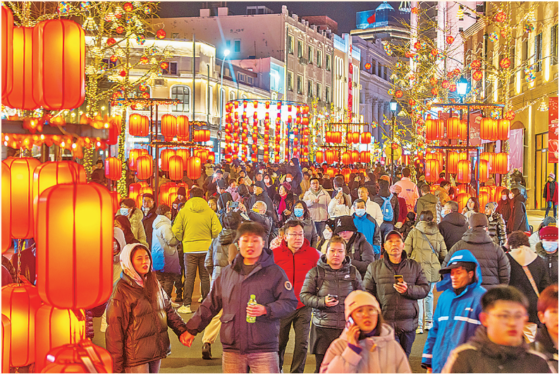
■春节期间,中山路区域人流量大幅增加。

飞雪迎春到。2月19日上午,市南区召开深化推进“强基层基础 到基层领干 为基层赋能”工程暨“新春新业绩 建功开门红”动员会议,以一场动员大会为龙腾虎跃的新一年打响“发令枪”。