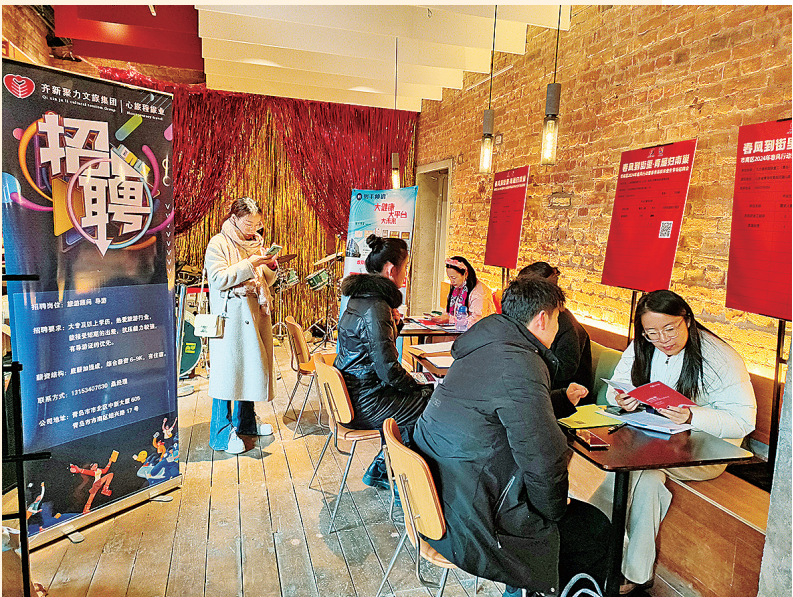
■市南区2024年春风行动暨春季高校毕业生专场招聘会现场。

放眼市南,处处洋溢着“人勤春来早”的勃勃生机,干部群众以“开年即开跑”的姿态,向春天、向未来、向更好的日子进发。龙年春节后首个工作日,全省高水平开放暨高质量招商引资大会在济南召开,动员全省广大干部群众深化高水平对外开放、拓展高质量招商引资。市南区将发挥作为全省对外开放桥头堡的优势,主动服务、深度融入全国开放大局,着力塑造开放包容大环境,做实中国—上海合作组织技术转移中心,全力稳住外贸外资基本盘,培育内引外联的产业体系,在全市开放发展中“打头阵、当先锋”。开创高质量招商引资新局面,精准聚焦“6+1”主导产业和新领域新赛道,瞄准国内及世界500强、央企国企、上市公司、省内龙头企业,深化运用“四位一体”资本招商打法,开展“项目落地季”攻坚行动,加快引进一批高“含金量”、高“含新量”的重点项目,力争一季度落地重点项目28个、新增优质储备项目50个、实际利用外资超过1亿美元,推动产业延链补链强链,以招商引资之“进”促实体经济之“稳”,推动经济高质量发展。