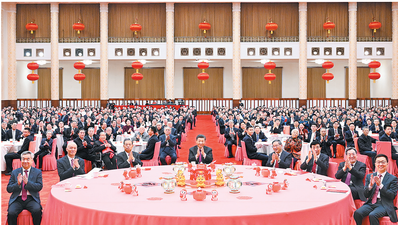
2月8日，中共中央、国务院在北京人民大会堂举行2024年春节团拜会。党和国家领导人习近平、李强、赵乐际、王沪宁、蔡奇、丁薛祥、李希、韩正等同首都各界人士齐聚一堂，共迎新春。

■回顾一年来的拼搏奋斗，我们更加深切地体会到，以中国式现代化全面推进强国建设、民族复兴伟业，既是中国人民追求美好幸福生活的光明之路，也是促进世界和平发展的正义之路。只要我们坚持道不变、志不改，一以贯之、勠力同心，就一定能够战胜前进中的各种艰难险阻，不断迈向成功的彼岸