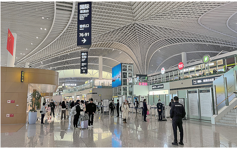
■胶东国际机场航站楼。

时间一刻不停地描摹着奋进者的姿态。回顾2023年的青岛胶东临空经济示范区,广袤的天地间播起奋进鼓点,国际航空枢纽功能凸显、空中门户规模能级提升;航空都市建设由表及里,重点项目多点开花;上合临空“同频共振”,上合空港新城四大基地落笔生花,一座高标准规划、高起点建设的“现代范”上合空港新城呼之欲出。