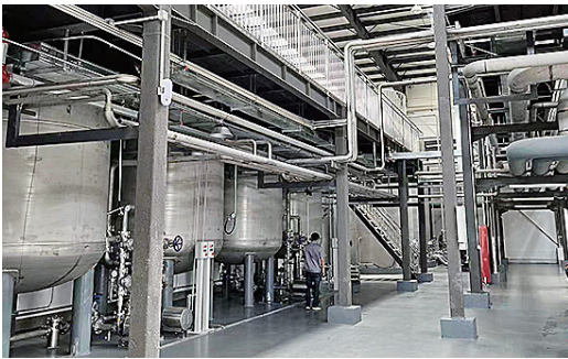
■昌进生物生产线。

青岛佳海临空产业园、华通联东·青岛临空国际智造港项目陆续交付使用;青岛空港综保展示交易中心项目二次结构砌筑工程进入收尾阶段;昌进生物二期两条生产线投产……青岛胶东临空经济示范区正以项目建设集聚发展动能,带动上合空港新城崛起。