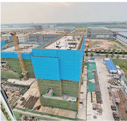
▲临空区项目加紧建设中。