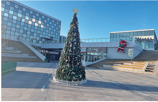
■空港食集外景。

胶东国际机场是青岛面向世界的门户,单日最高客流量可达8万人次。为将机场“流量”变“留量”,临空示范区在距离胶东国际机场仅3公里区域打造空港食集,通过与机场航站楼美食错位发展,打造胶东美食、上合美食、进口冷链美食、日韩特色美食盛宴。