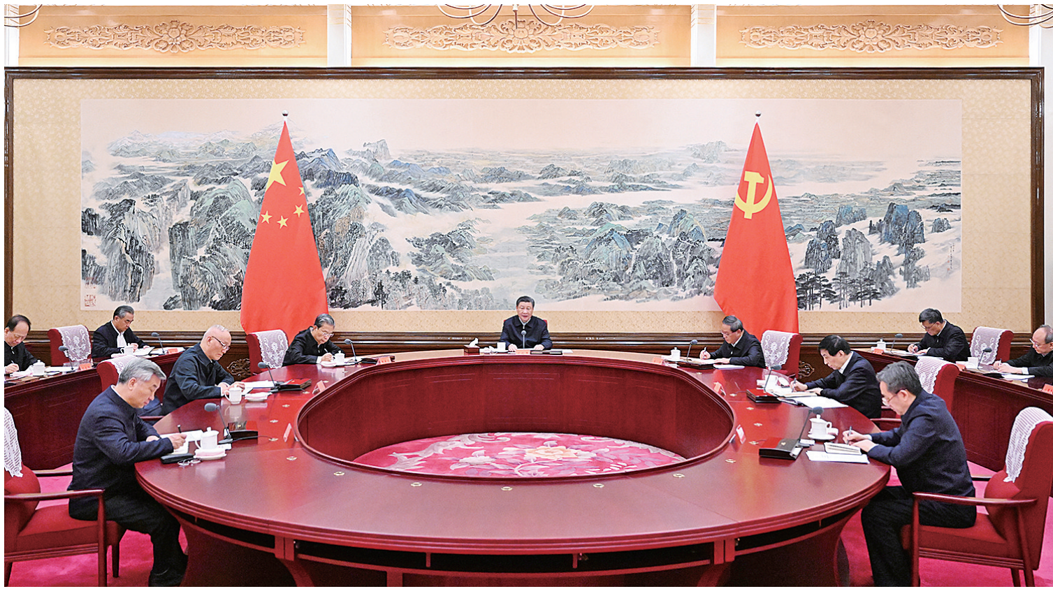
12月21日至22日,中共中央政治局召开学习贯彻习近平新时代中国特色社会主义思想主题教育专题民主生活会,中共中央总书记习近平主持会议并发表重要讲话。