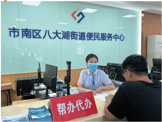
打造全市“标杆型”街道便民服务中心,将优质政务服务送到群众身边。