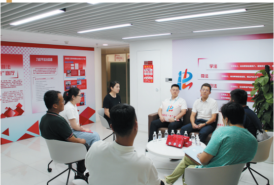
暖南普法惠客厅开展普法沙龙活动。

“全周期管理”长效化。牵头制定《关于鼓励创投风投 完善促进招商引资和国有企业创新发展容错纠错机制的暂行办法》,推动建立垃圾清运“呼叫联动机制”,解决辖区内快递企业三轮车挂牌难等问题。在全区开展警示教育7场,覆盖全区党员干部、公职人员1.4万余人。建好用好青岛市亲清政商关系廉洁教育馆,全面展现我市打造一流营商环境的举措和成果,教育引导党员干部做到亲而有度、清而有为。自10月底开馆以来,已接待全市各级机关、企事业单位参观学习140场,共计3400余人次。