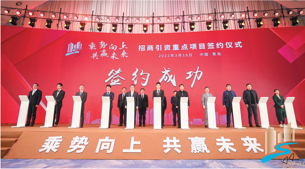
市南区招商引资质重点项目签约。

市南区积极探索历史街区焕新与优化营商环境协同发展的新路径,通过深度挖掘历史文化底蕴,打造街区独特的文化IP以及优化文化产品,培育了“最美”+“醉野”美食产品、“城之南·海之角”住宿产品、“海誓山盟”婚恋全业态产品以及18条文旅路线为代表的系列品牌,以品牌之力擦亮老城无限的生机与