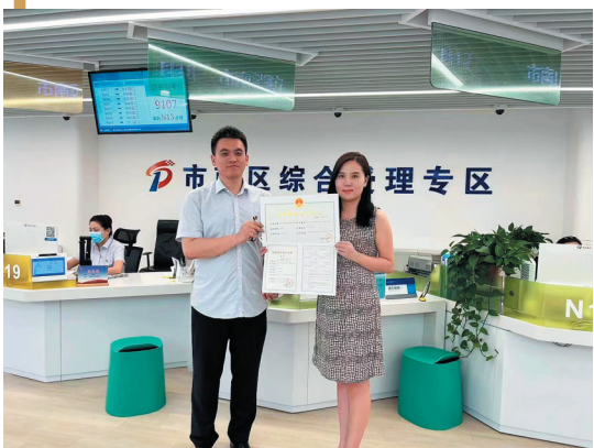
企业应用全流程电子化审批,快速办理出版物零售许可证。