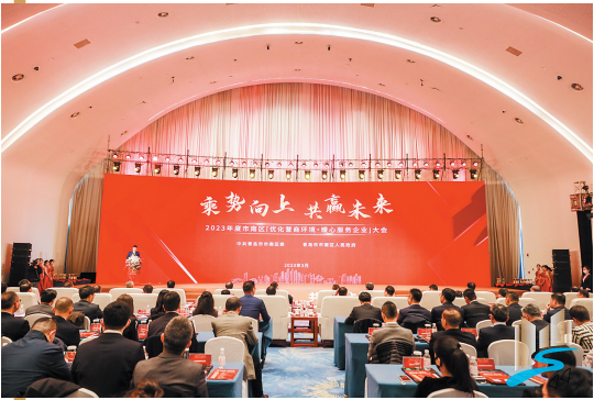
市南区“优化营商环境·暖心服务企业”大会。